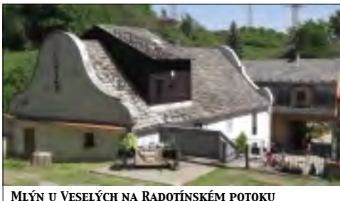
MLÝN U VESELÝCH NA RADOTÍNSKÉM POTOCE