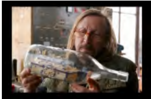
Z FILMU POUKATA

Prvním vyvrcholením festivalu byl film Zdeňka Jiráského Poupata . Deprese maloměsta, kde vládne nezaměstnanost a práce hradlaře je vlastně štěstím pro rodinu. Jenže rodina se rozpadá. Hradlař to