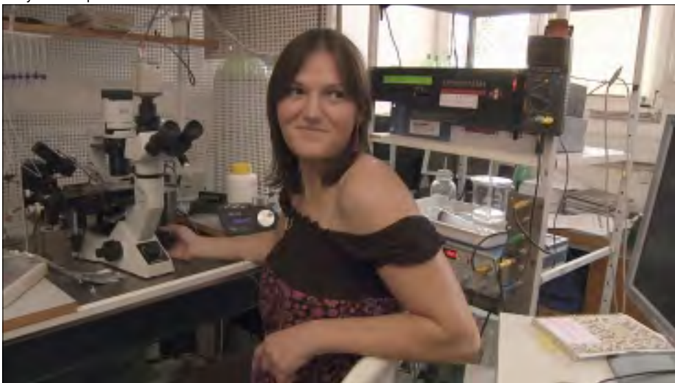
Z FILMU JANY POČTOVÉ: GENERACE SINGLES