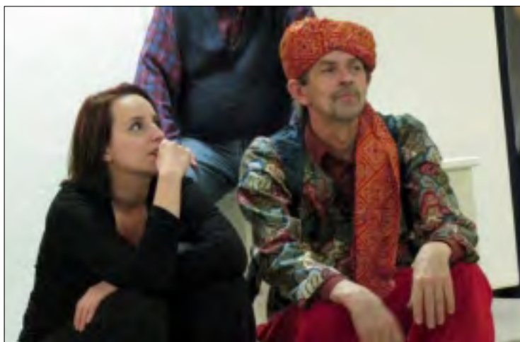
ZE ZKOUŠKY KOMEDIE OMYLŮ