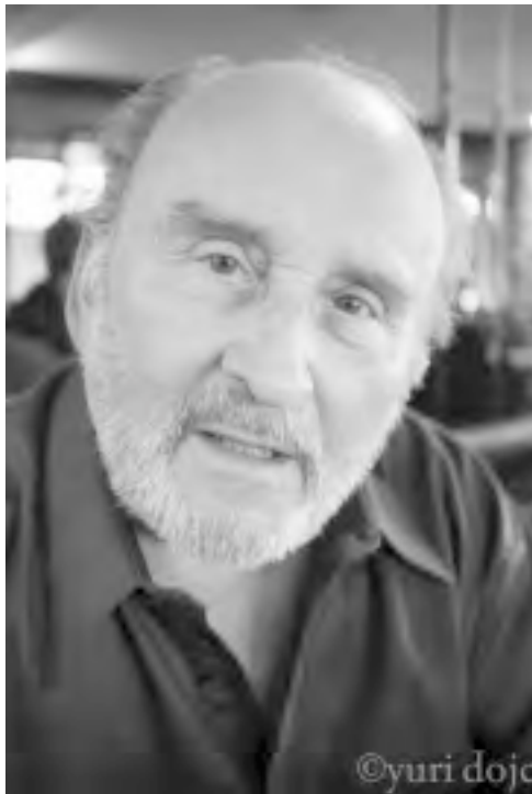
PORTRÉT V. STRAŽOVCE

Neviem ako ostatní diváci, ja som bol týmto nedeľným popoludným nadšený a očarený priam renesančným záberom,