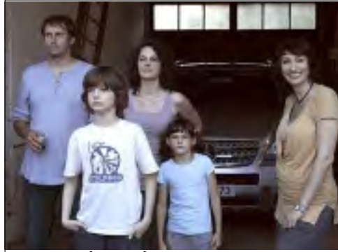
RODINA JE ZÁKLAD STÁTU

Robert Sedláček mne poprvé oslovil filmem Pravidla lži . Tentokrát to bylo opět přirozené a nekonvenční s filmem Rodina je základ státu . Bývalý učitel působící v bance je obviněn z tunelování. Rozhodne se utéct s rodinou na Moravu a vyřešit své vlastní problémy, které po léta zanedbával. Když dorazí na Moravu, setká se zcela náhodně ve Strážnici se svými přáteli rovněž