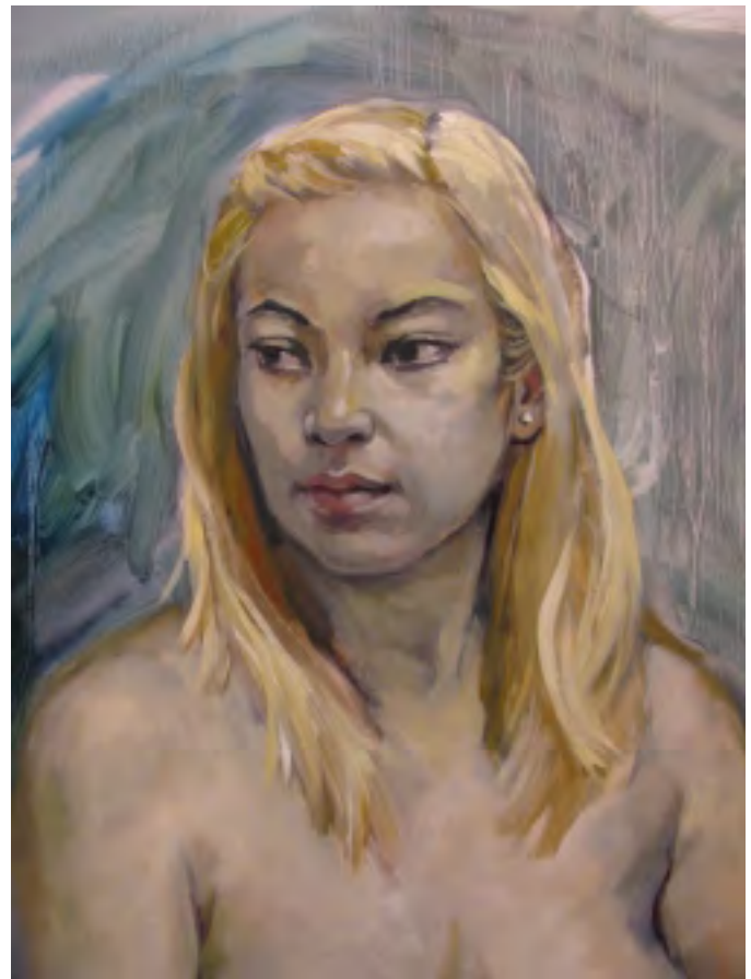
Foreboding- Oils-49x32 (Detail)