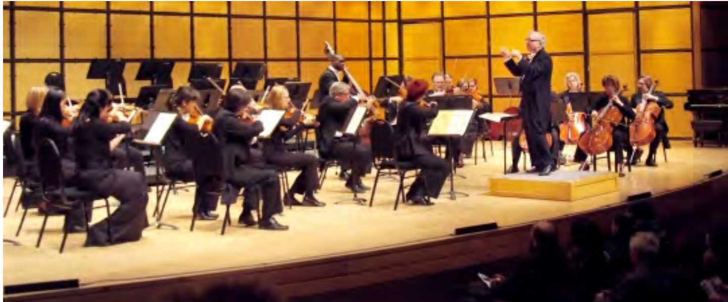
Z KONCERTU V NORTH YORKU