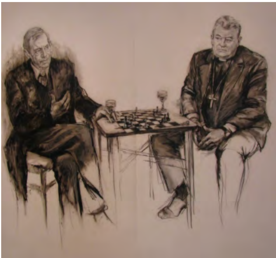
Z VÝSTAVY V LOOP GALLERY: VZÁJEMNÝ VÝSLECH - VÁCLAV HAVEL A DOMINIK DUKA