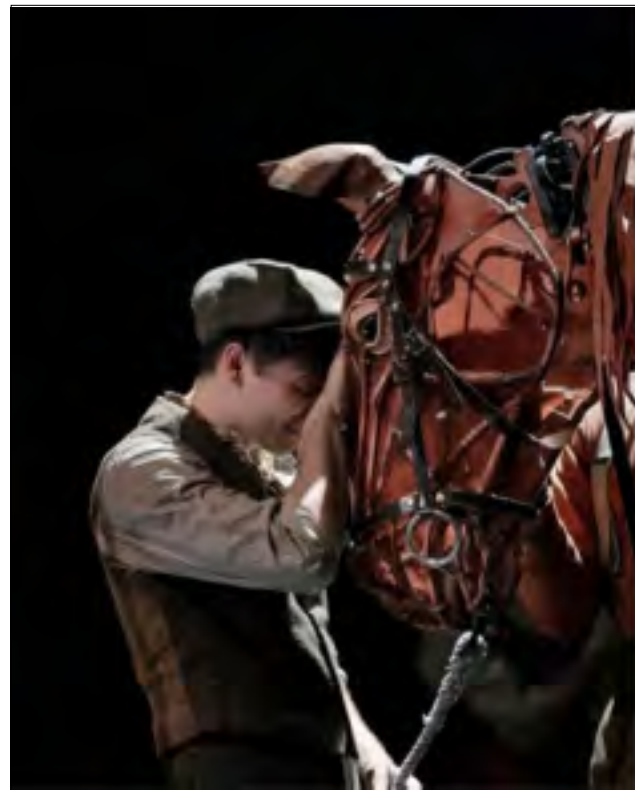
Z FILMU VÁLEČNÝ KŮŇ

Týden po zadání oscarovské soutěže jsme se sešli v kavárně Book&Beans , Mervyn sesbíral od každého člena klubu lístek s názvem nejlepšího filmu, spočítal návrhy a vyslovil výsledek našeho hlasování o nejlepší film roku 2011: „Hlasy dostaly jen dva filmy z nominovaných, a to rovným dílem Spielbergův film War Horse ( Válečný kůň ) a film Midnight in Paris ( Půlnoc v Paříži ) od Woody Allena.“ Kolem stolu zašumělo spokojeně vzrušením, že se členstvo klubu v prvním kole shodlo na výběru dvou nejlepších, což byl slibný pokrok na klikaté cestičce k nejlepšímu z nejlepších filmů roku 2011, a zároveň se vytvořila bojová linie, ze které vyplyne náš finalista na Oscara.