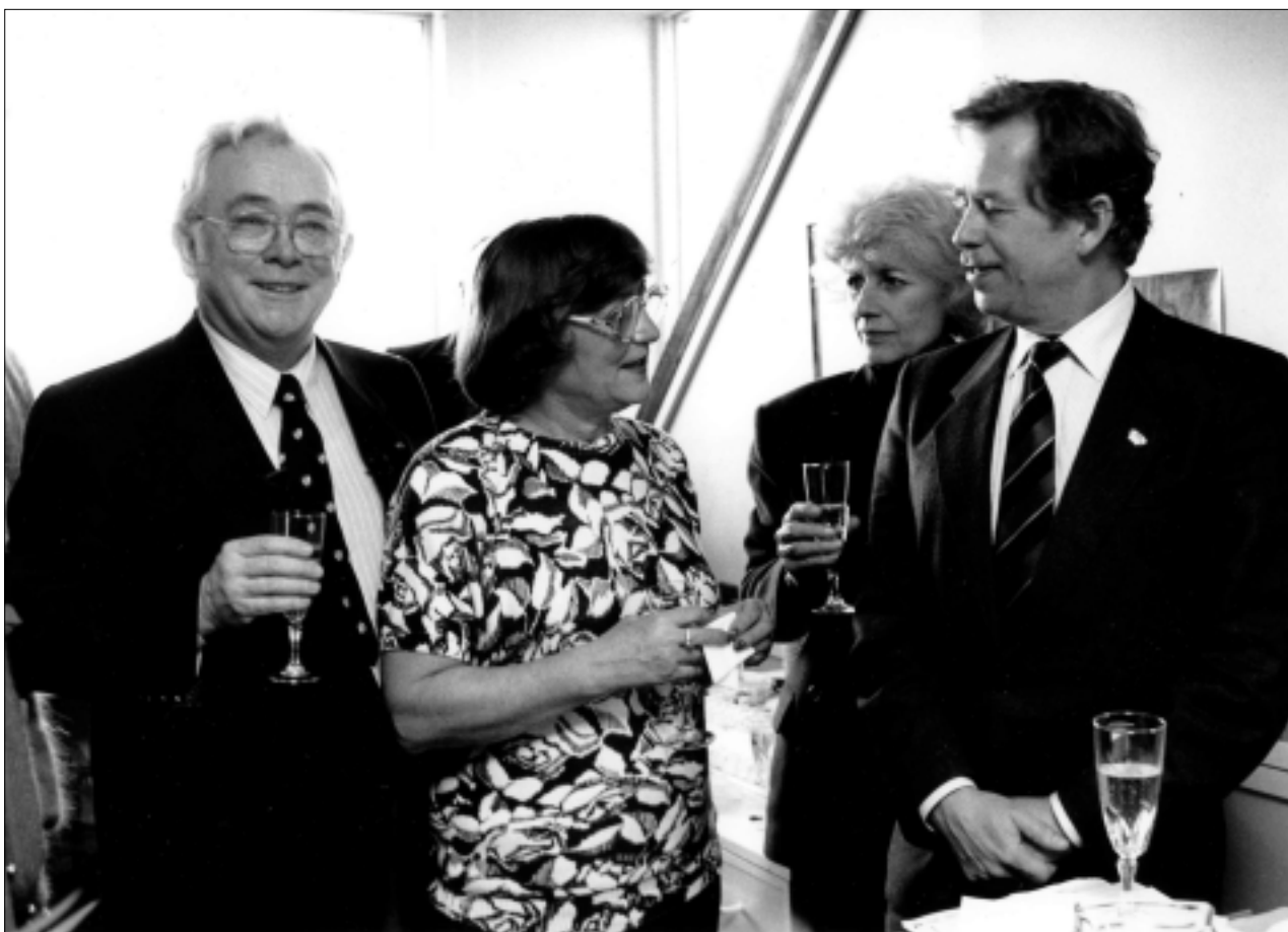
MANŽELÉ ŠKVOREČTÍ (VLEVO) A VÁCLAV A OLGA HAVLOVI PŘI SETKÁNÍ V TORONTU V ÚNORU 1990

Další hrou, která na mne udělala dojem byla jednoaktovka Audience . Slyšel jsem ji poprvé v