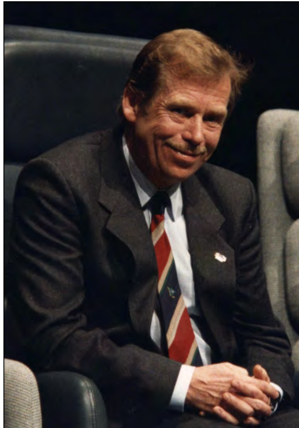
VÁCLAV HAVEL V KANADĚ V ROCE 1990