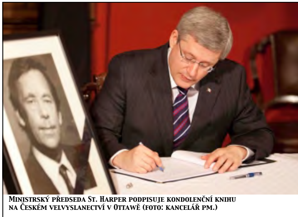
MINISTRSKÝ PŘEDSEDA ST. HARPER PODPISUJE KONDOLENČNÍ KNIHU NA ČESKÉM VELVYSLANECTVÍ V OTTAWĚ

E-mail: czechevents.novotny@gmail.com www.czechevents.net