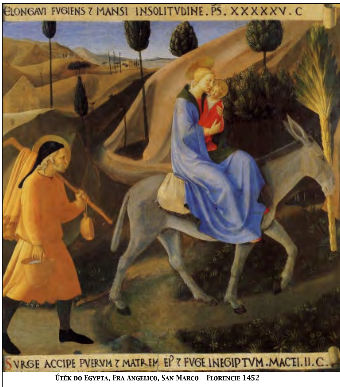
ÚTĚK DO EGYPTA, FRA ANGELICO, SAN MARCO - FLORENCIE 1452

Veselé Vánoce a vše dobré v roce 2012 přeje Satellite