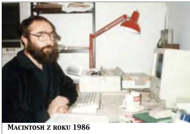
MACINTOSH Z ROKU 1986

Masarykův ústav a Československé sdružení v Kanadě zakoupily první počítače značky Macintosh . Tyto počítače neměly pevné disky (hard discs). Vše se