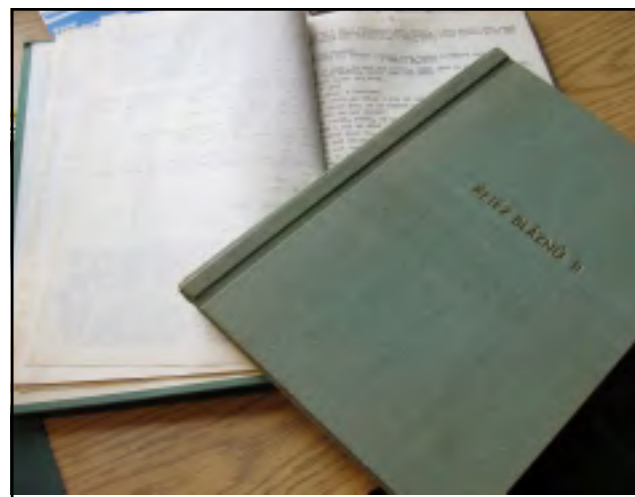
ŘETĚZ BLÁZNŮ V SAMIZDATOVÉM VYDÁNÍ