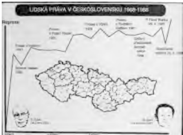
DIGITÁLNÍ NÁVRH PLAKÁTU NA POČÍTAČI. TEHDY SE TATO TECHNIKA BRALA JAKO ŽERT.