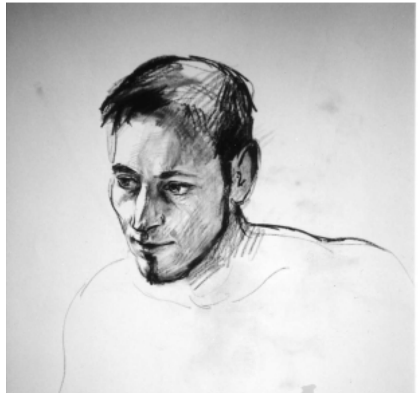
Skica mladého muže - uhel