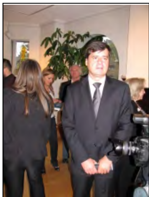
POLSKÝ KONZUL M. CIESIELCZUK NA TISKOVÉ KONFERENCI K FESTIVALU