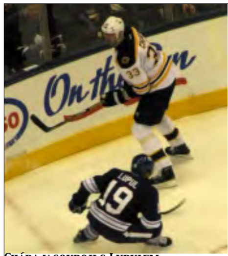
CHÁRA V SOUBOJI S LUPULEM

"Měli jsme po celý zápas převahu a podařilo se nám skórovat v úvodu první a druhé třetiny. I když jsme v určitých fázích nehráli tak dobře, podařilo se nám to přežít a dotáhnout zápas do vítězného konce," hodnotil zápas kapitán Bostonu Zdeno Chára.