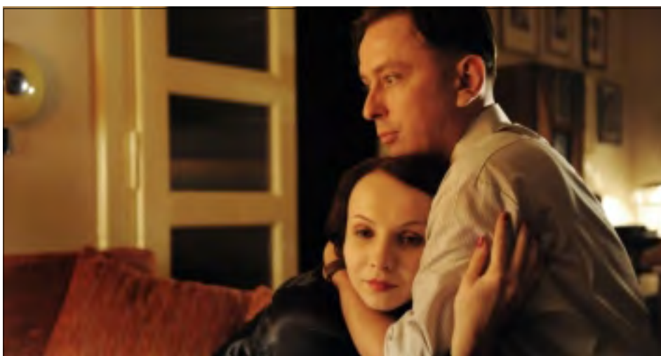
Z ČESKÉHO FILMU PROTEKTOR