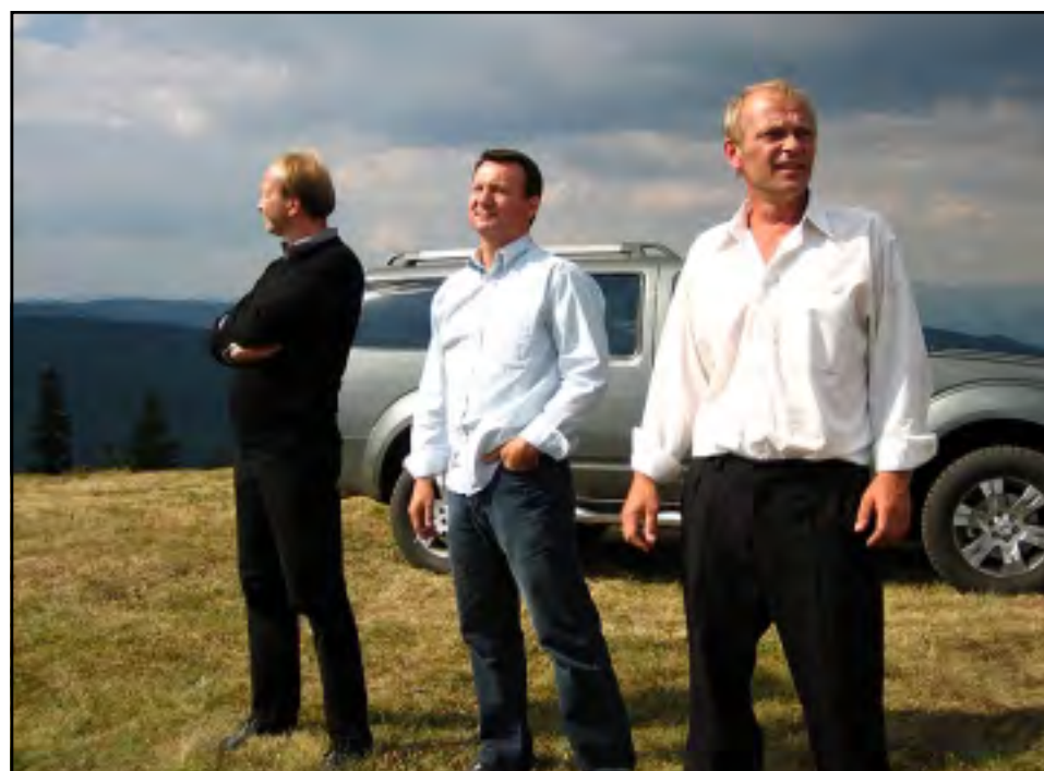
ZE SLOVENSKÉHO FILMU POKOJ V DUŠI