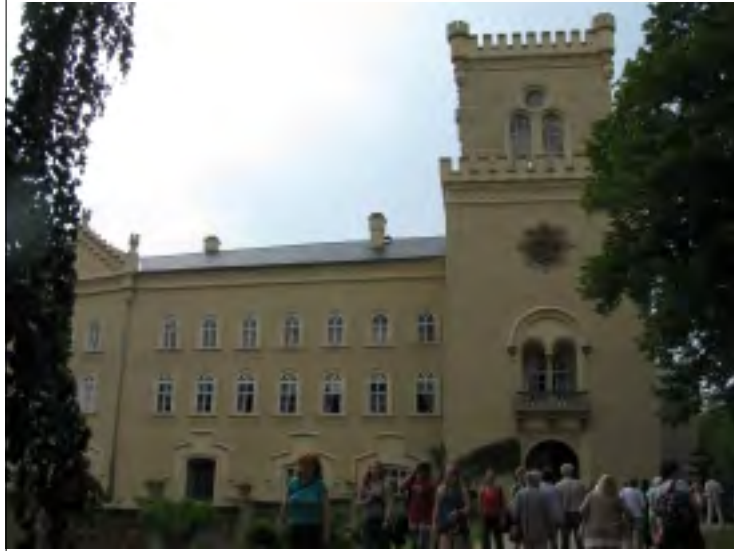
ZRENOVOVANÝ ZÁMEK CHYŠE

ve Florencii místní řidiče autobusů, kteří s milimetrovou přesností projíždějí úzkými uličkami. Co udělal náš řidič, když viděl, že doprava nezahne? Zatočil doleva a po úzké cestě plné zatáček to s milimetrovou přesností k rozhledně vycouval. A tak se i babičky o berlich podívaly na údolí od Schillerovy rozhledny, která byla obnovena podle původní stavby ze začátku století.