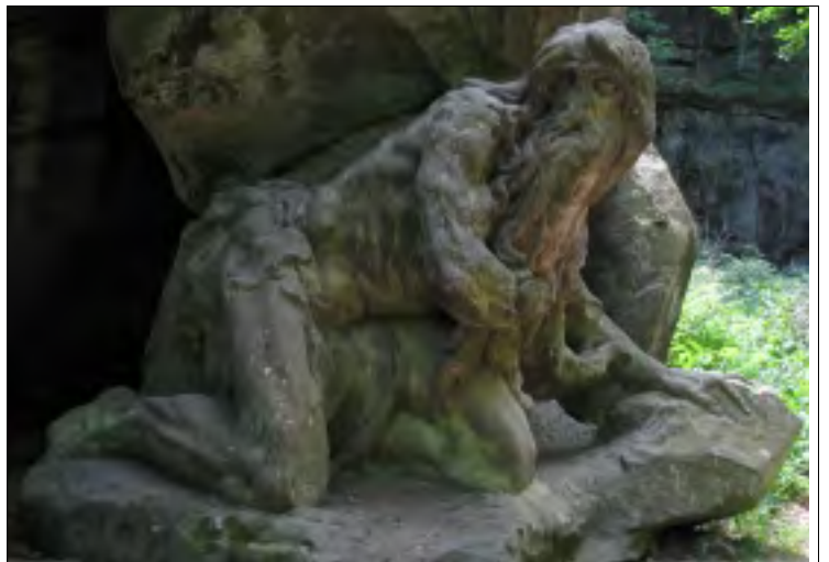
POUSTEVNÍK GARINUS OD MATYÁŠE BRAUNA PO ROKU 1720 V NOVÉM LESE NAD ŽIRČÍ