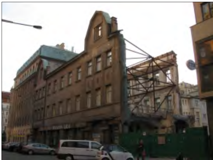
POLOZBOŘENÝ DŮM SOUSEDÍ S DOMEM NA VÁCLAVSKÉM NÁMĚSTÍ, URČENÝM K DEMOLICI

V druhé polovině osmdesátých let, kdy už cenzura nebyla tak zlá, ale kulturní devastace pokračovala, zmizela z Prahy řada historických budov včetně Nádraží Těšnov. V tu dobu přišla Mladá Fronta s článkem, že se bude bourat i Národní muzeum. Byl to aprílový žert,