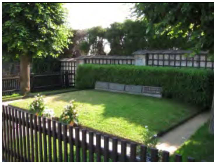
HROB T. G. MASARYKA, JEHO MANŽELKY CHARLOTTY, SYNA JANA A DCERY ALICE

Podíváme-li se na Václavské náměstí, můžeme zde vidět téměř vše. Muzeum na štěstí stále stojí, i když se občas objevují v omítce jizvy po srpnu 1968. Můžeme vidět kolik historických domů zmizelo a kolik je tam nových skleněných hangárů. Minule jsem si povzděchl, že zmizel i šenk Vrbovec v dolní polovině náměstí. Teď pro změnu má zmizet dům na rohu Opletalovy ulice. Nepomáhají zatím protesty památkářů i Pražané se rozhodli jít do ulic a demonstrovat. Podívali jsme se na barák nejen zepředu, ale i z druhé strany a pochopili jsme: stavební společnost již zadní část domu pěkně vykuchala, ale tak, aby stěny zůstaly. Tím vzbudila