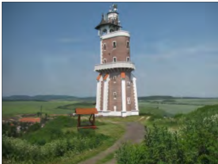
SCHILLEROVA ROZHLEDNA V KRYRECH S CESTOU, PO KTERÉ JSME NAHORU PŘICOUVALI AUTOBUSEM