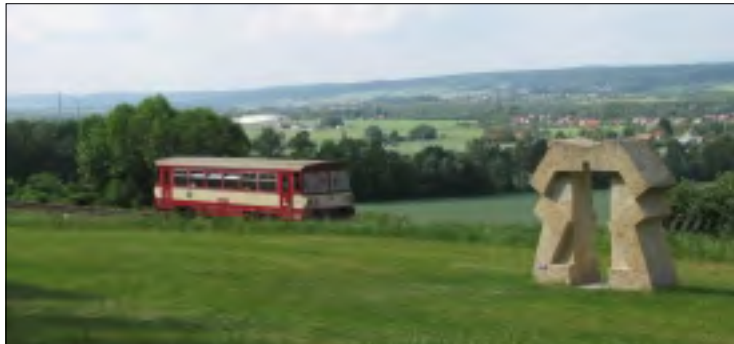
MOTOROVÝ VLAK PROJÍZDÍ KOLEM KŘÍŽOVÉ CESTY 21. STOL. PŘEDNÍCH ČESKÝCH SOCHAŘŮ TŘÍ GENERACÍ Poblíž BRAUNOVA BETLÉMU