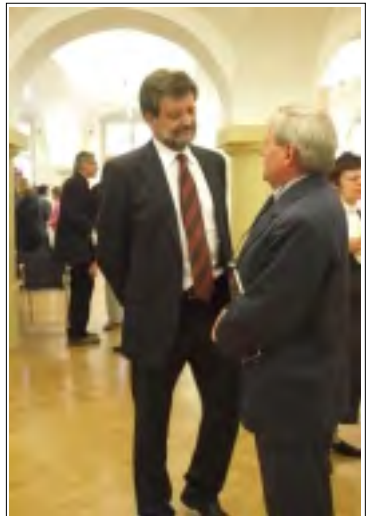
MINISTR JAN KUBICE S DĚKANEM PROF. MIROSLAVEM ČERVINKOU PŘI ZAHÁJENÍ VÝSTAVY

Poté co jsem viděl obrazy, které budeš vystavovat v Hradci Králové, ale hlavně po našem včerejším rozhovoru, jsem začal znovu přemýšlet o tvé práci. Napřed jsem myslel, že o ní uvažují jinak než předtím, ale pak jsem si uvědomil spojitost mezi tvými rannými obrazy a věcmi, na kterých pracuješ nyní. Tím mám na mysli tvůj odpor vůči zůstávání na pouhém povrchu subjektu - tedy něčem, co by se dalo očekávat od někoho, kdo je vnímán a označován jako portrétista, což by bylo, pokud jde o tebe, velice mylné ve své nedostatečnosti - a touha dosáhnout daleko do hloubky organismu, jak metaforicky, tak i hmatatelně. Kladeš zároveň otázky, z mého hlediska velice zajímavé, počínaje těmi nejelementárnějšími, například 'jak člověk funguje?', až po tu nejsložitější a nezodpověditelnou, 'kam jdeme?'. Potřebujeme na oné pouti průvodce? A pokud ano, kdo by jimi měli být? Tady se opět naskytají otázky kontinuity a inspirace,