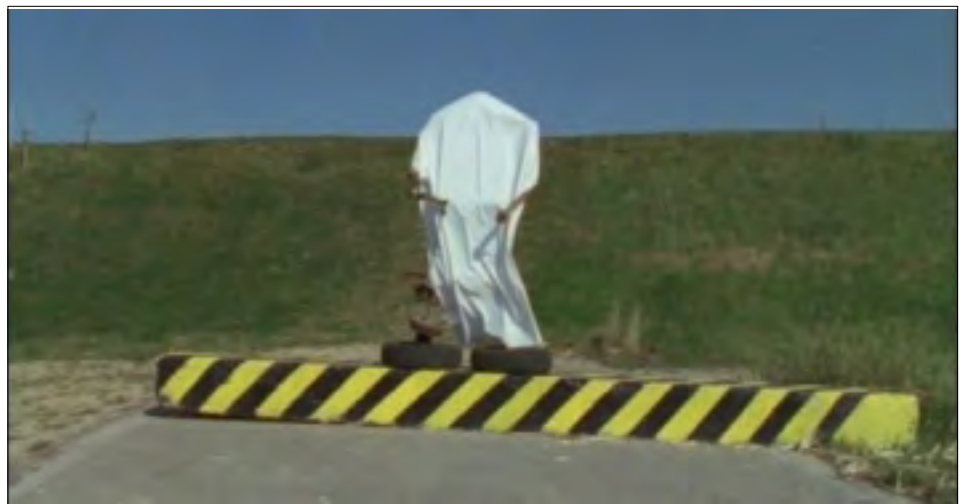
KONEC SILNICE A SOCHA STRAŠÁKA ZŮSTALY PO POLÍCH V NOŠOVICÍCH

Zahájil jsem dokumentem, který získal cenu Dagmar Táborské Nesvatbov , cenu