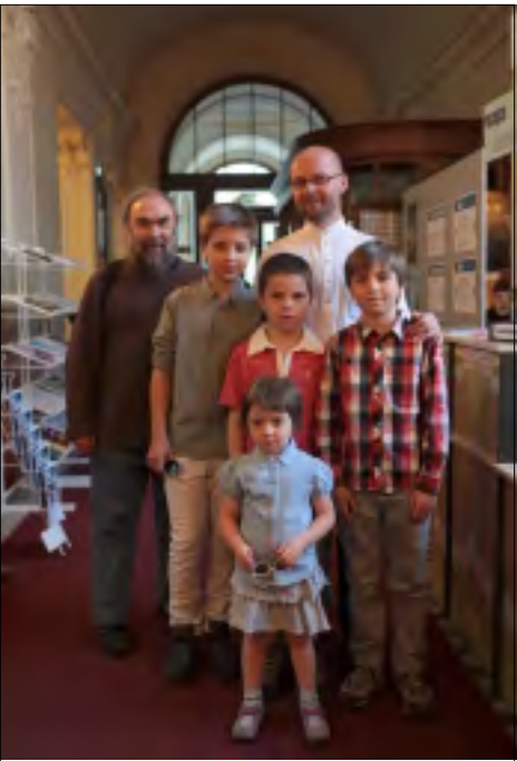
SETKÁNÍ BŘEZINŮ V PLZNI

být vylhané, ale pravdivá skutečnost nemusí být tak vzdálená od nepravdivé. Vina se nevypaří a jako u Dostojevského přichází trest. Nebudu spekulovat, o tom jestli je spravedlivý nebo krutý. To by bylo až na druhý díl filmu, ale pak by se z toho stal americký televizní seriál.