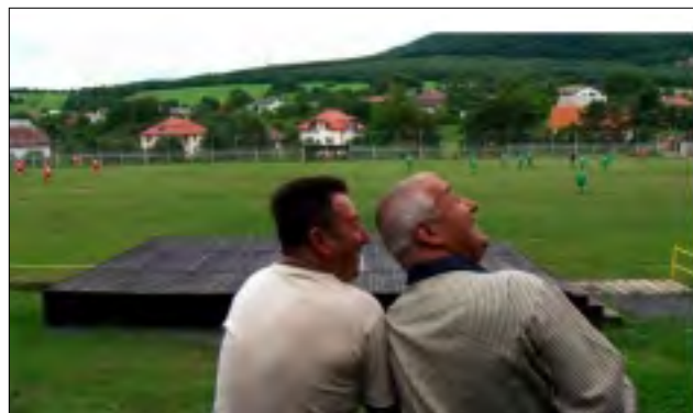
Z FILMU NESVATBOV

nefunguje. Nefunguje ani ekonomická stimulace, kdy nabízí za každé narozené dítě odměnu, ale starosta se nevzdává a pokračuje ve svých hlášeníích a motivačních balíčcích. (Film poběží v Torontu v Innis Town Hall Theatre 3. května v 21:30 a 4. května v TIFF Bell Lightbox 4 ve 14:00). Film dostal na festivalu cenu Dagmar Táborské, která je dotována cenou 60 000 korun.