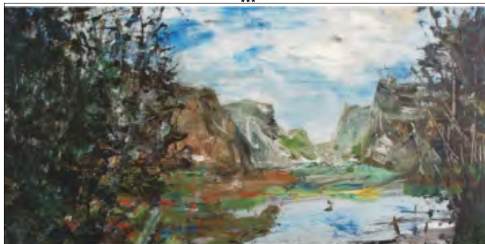
Standa Sedlák Od moře k moři Obrazy

3.5. - 22.5. 2011 Vernisáž 3.5. v 18 hodin Galerie Vyšehrad na ul. Libušinské nám.