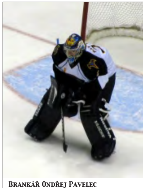
BRANKÁŘ ONDŘEJ PAVELEC