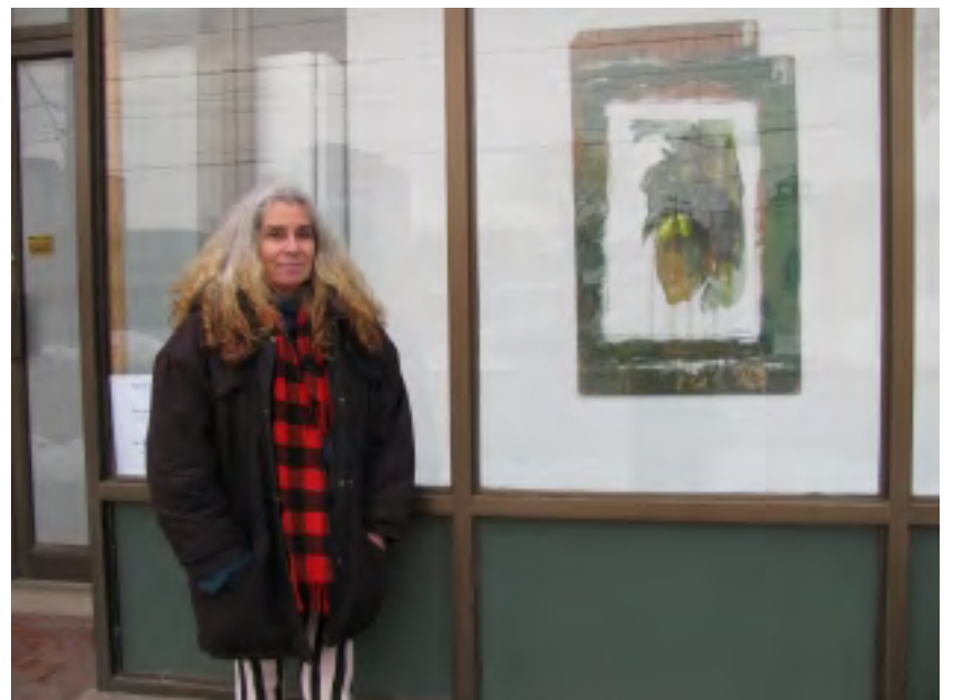
Malířka s obrazem

Howard Park Institute Window Gallery 2088 Dundas St. West, Toronto do 28.února 2011