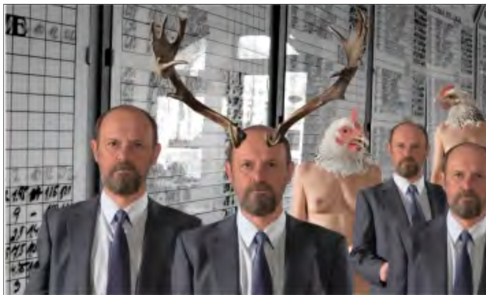
Z FILMU J. ŠVANKMAJERA: PŘEŽÍT SVŮJ ŽIVOT

Je to stará otázka. Zda cestou k umění může být šílenství? Lépe řečeno zda nás obraz nejrůznějších psychologických sklonů a handicapů člověka může přiblížit estetickému či filozofickému pohledu na jeho život. Vedle všech psychoanalytických drsnářů a mytologií podvědomí nabídl kdysi Švankmajer svou českou a originální odpověď. Převlekl tajnosti našeho psychického života do groteskní hry animovaného i naivistického divadla, jež přitom imaginativně zrcadlilo nejrůznější slepé mechanismy lidské psychiky.