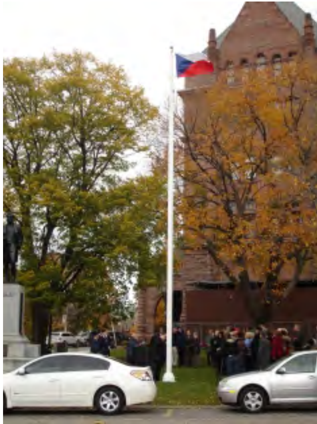
ČESKOSLOVENSKÁ A ČESKÁ VLAJKA PŘED BUDOVOU ONTARIJSKÉHO PARLAMENTU

to (a to je zvědavost, již ve mně pět páně náměstkových slov vyvolalo), co jeho otec a jiní levicoví intelektuálové cítili (a jak reagovali), když jejich režim soudil Miladu Horákovou a ulicemi táhly zástupy jejich soudruhů (hlavně soudružek) zuřivě vymáhajících smrt jedné z největších žen českých dějin. A snažím se pochopit, jak lidé narození ve stejném