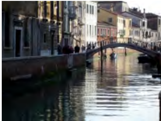
JEDEN Z MNOHA BENÁTSKÝCH MOSTŮ

Při páté cestě v roce 2003 mi pro změnu bankomat hned po příjezdu sežral kreditní kartu a v Palermu mně ukradli foťák. Letos to byl tedy můj šestý pokus a musím říci, že téměř bez problémů. I když i tentokrát se nějaká ta chybička vloudila. Moje žena, která se celý srpen svědomitě připravovala na cestu do Itálie a zjišťovala, nezjistitelné - kolik ji bankomat vydá najednou peněz. Rozporuplné odpovědi přicházely, protože každý automat vydá jinou sumu. A moje žena v okamžiku odchodu z domu na letiště zjistila, že tuto kreditní či debitní kartu nemá. Nastalo zoufalé hledání obrácení šuplat, až v jednom z nich byla nerozlepená obálka. To už jsme měli asi dvacetiminutové zpoždění. Jenže to zároveň znamenalo, že