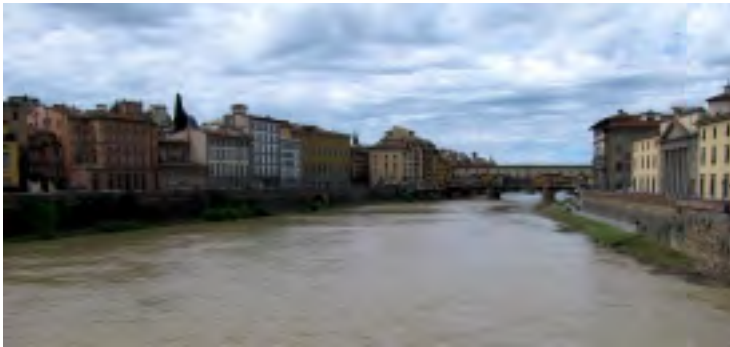
PONTE VECCHIO VE FLORENCII

nepřetržitě celé hodiny žvaní. Většinou začnou větou, kterou znám z dětství: „Dove sei tu?“ Ke všemu štěbetají italsky a před tím není úniku. Jakmile jedna padne únavou, okamžitě začne další. Takto si předávají štafetu až do západu slunka. Po západu slunce se rozsvítí světla televizních obrazovek a všichni čumí na Berlusconiho stupidní show a mezi tím turisté pozorují velikány italských dějin, procházejí se po Ponte Vecchio. Sledují sochy Michelagela, obrazy Boticelliho, výstavu, která nese hrdé jméno Caravaggia, ačkoliv je tam kromě jeho legendární medúzy pouze jeden jeho obraz. Přesto je to skvělý zážitek, být po dvanácti letech opět v tomto městě. Co víc si člověk může přát?