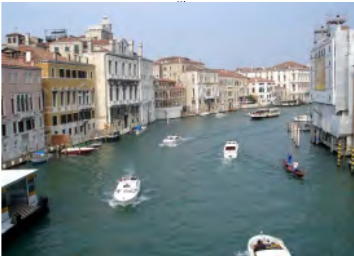
A JEŠTĚ JEDEN POHLED NA BENÁTKY

Aleš Březina, Florencie, Benátky, Praha