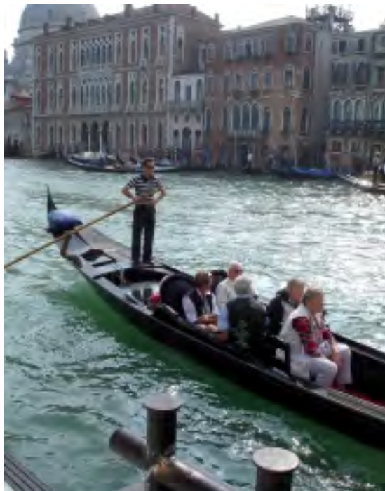
PRUHOVÁNÍ GONDOLÁNI JSOU SYMBOLEM BENÁTEK

Až v roce 1996 se Slavia prokousala až do čtvrtfinále Poháru UEFA a narazila na slavný AS Řím. Z Prahy vyrazilo několik autobusů. A tak se mi podařilo vyrazit do věčného města. Zájezd sliboval jeden den v Římě. Jenže neukáznění fanoušci