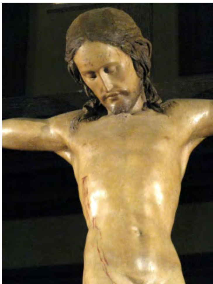
ZRESTAUROVANÝ MICHELANGELŮV KRISTUS SE VRÁTIL DO FLORENCIE

Když jsem přijel domů do Prahy, tak právník, který tehdy ještě nebyl prezidentem, zavřel hranice a bylo po vtákách. O pár let později se stal prezidentem a mně oznámili, že jsem se zdržoval v Československu pouze dočasně a tak jsem se octnul za mořem. Od té doby jsem viděl nejvíc Italů, když Itálie porazila Německo 3:1 ve finále MS ve Španělsku. To bylo na křižovatce St. Clair a Dufferin.