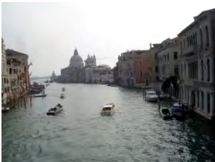
POHLED NA BENÁTKY Z DŘEVĚNÉHO MOSTU