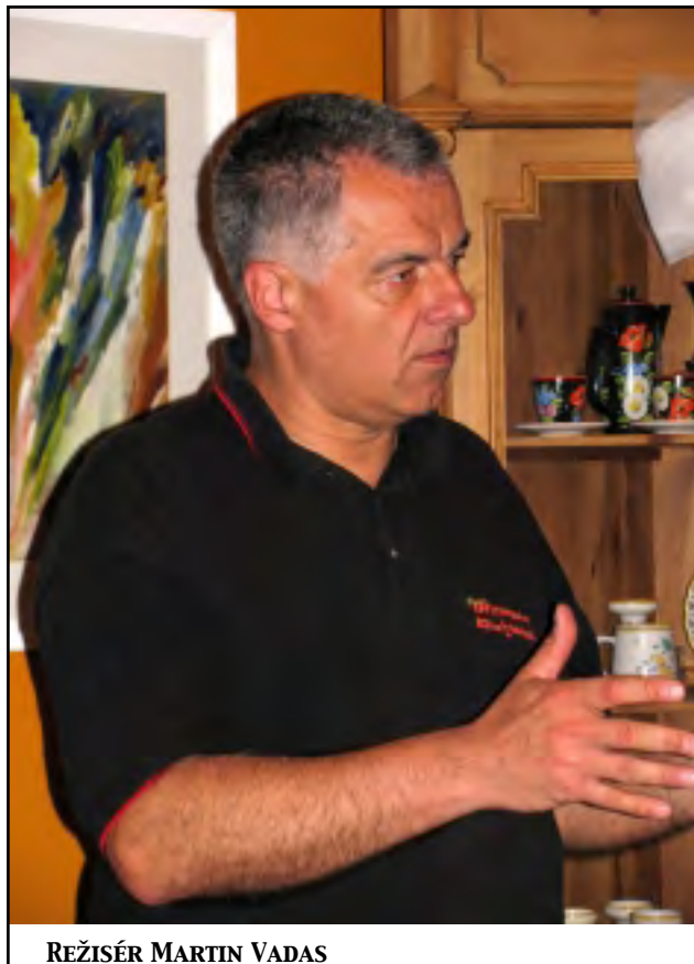
REŽISÉR MARTIN VADAS

Oba filmy spolu tématicky souvisely a pojednávaly o období padesátých let u nás. Film Zuzany Hahnové byl rozšířený i o svědectví lidí ze Severní Koreje a z Kuby, kde jsou lidská práva komunistickým režimem stále drasticky pošlapávána.