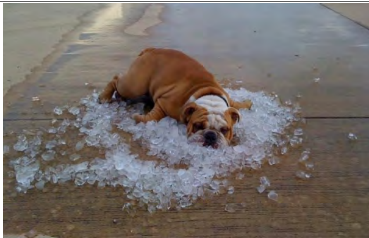
I V TOM NEJVĚTŠÍM HORKU, LZE NALÉZT ŘEŠENÍ