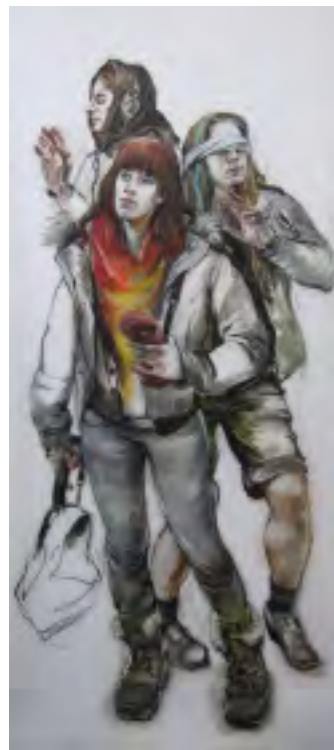
Z výstavy Puzzle 2009