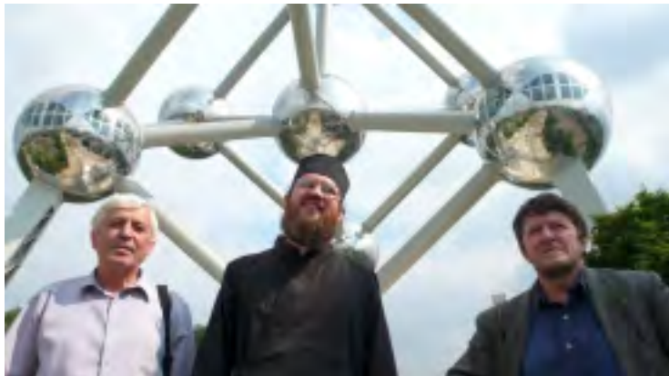
DELEGACE Z OSADNÉ V BRUSELU