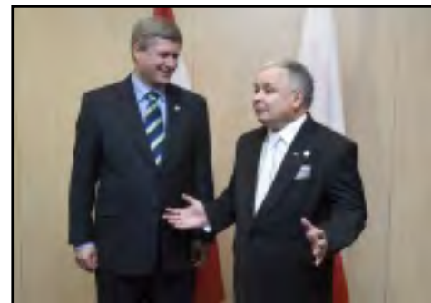
Kanadský premiér Stephen Harper s polským prezidentem Lechem Kaczyńským na setkání NATO v Rize 27. 11. 2006.

Možný tlak ze strany prezidenta, který měl v létě 2008 konflikt s pilotem vládního speciálu, jehož chtěl přimět přistát v Tbilisi,