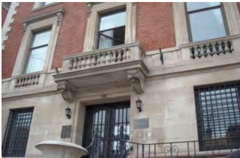
BUDOVA ČESKÉHO KONZULÁTU V MONTREALU OSÍŘELA A JE BEZ VLAJEK