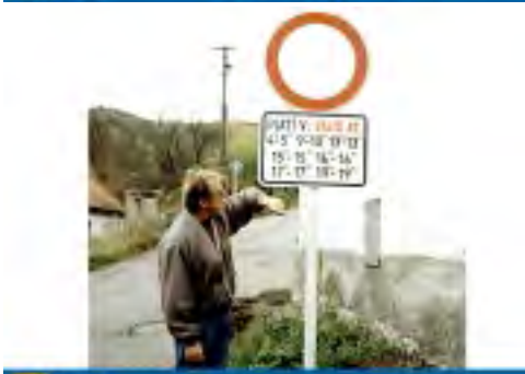
Já se z toho plánu ... ... 1. územní oddělení, 2010