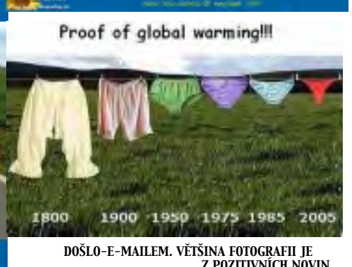
DOŠLO-E-MAILEM. VĚTŠINA FOTOGRAFIÍ JE Z POZITIVNÍCH NOVIN