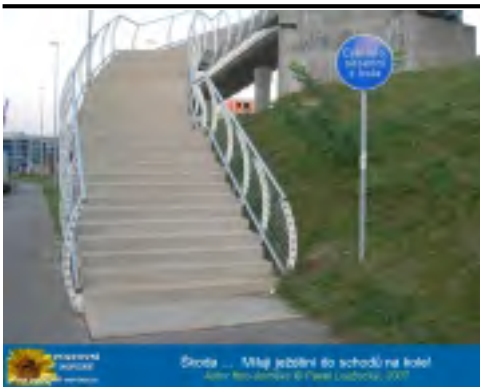
Štola ... Můj zlobení do schodů na hotel ... Hotel Newbury & Hotel Louisa, 2010