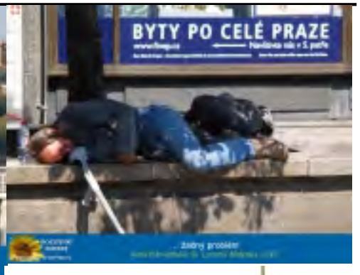
... Zdraví prosíme ... 1. územní oddělení, 2010