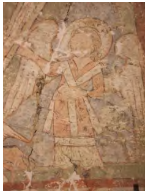
ANDĚL PO LEVICI KRISTA

kostel obnoven. Jednou z podmínek, které si stanovili, byl restaurátorský průzkum apsidy kostela. Výsledkem bylo objevení fresky v květnu 2007, místy až pod dvaceti nátěry a zásluhou profesionální práce restaurátora, akad. malíře Miroslava Slavíka.