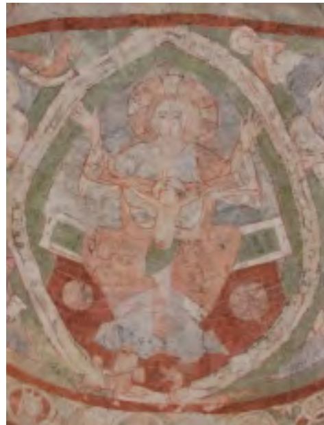
BŮH OTEC A KRISTUS

V dubnu 2009 byla, pod záštitou kardinála Miloslava Vlk a senátora Jana Nádvořníka, vyhlášena veřejná sbírka za účelem zachrany pozdně přemyslovských fresek. Ze stejného důvodu uspořádala kronikářka na radnici Městské části Praha 15, kam Hostivař patří, výstavu fotografií o průběhu odhalování fresek a Základní umělecká škola Hostivař benefiční koncert. V současné době je na účtu, díky lidem dobré vůle, na sto tisíc korun.