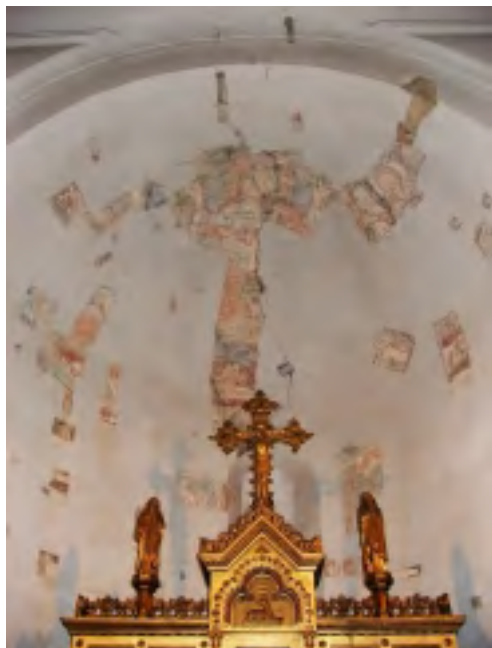
DRUHÁ FÁZE ODKRÝVÁNÍ FRESKY Z ROKU 2006