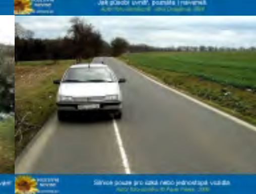
... ... 1. územní oddělení, 2010