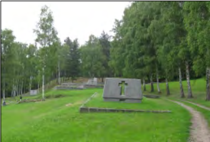
LEŽÁKY: PO VYPÁLENÝCH DOMECH ZŮSTALY JEN ZÁKLADY