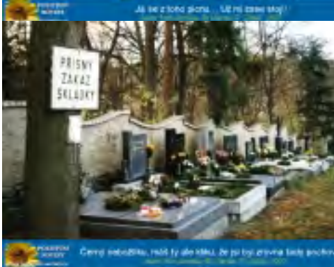
... ... 1. územní oddělení, 2010