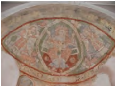
POHLED NA STŘED NÁSTĚNNÉ MALBY