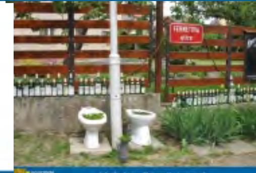
Jak góloví svržit, poznáte ... ... 1. územní oddělení, 2010