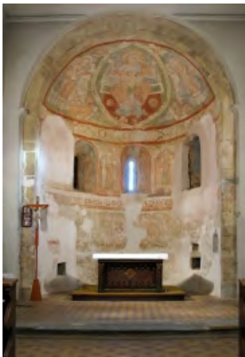
CELKOVÝ POHLED DO KOSTELA

Neméně zajímavou skutečností bylo odkrytí fragmentu mladší vrstvy (kolem roku 1500) s klečící postavou starce. Tato plocha byla restaurátorem sňata technikou transferu a posléze bude možné její uplatnění v jiných prostorách.