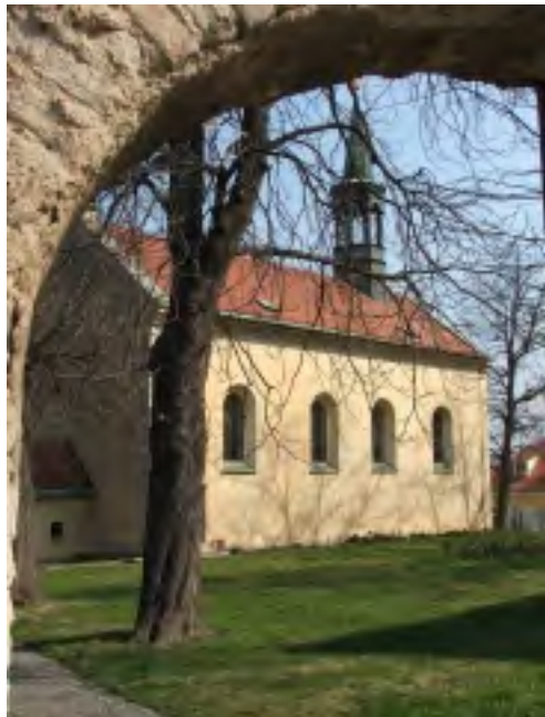
KOSTEL STĚTÍ SV. JANA KŘTITELE V HOSTIVAŘI

Zázraky se dějí. Mimořádný unikát, rozsáhlou nástěnnou malbu z konce 13. století, našli památkáři v pražském kostele Stětí sv. Jana Křtitele v Hostivaři. Restaurátoři dokončili první etapu záchranných prací. Odborníci se shodují, že v nenápadném kostele se jedná o objev středoevropského formátu. Stará nástěnná malba, která pokrývá celou konchu apsidy, rozsahem a kvalitou nemá v České republice obdoby.