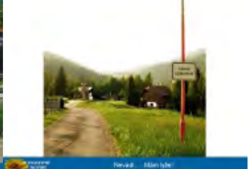
... ... 1. územní oddělení, 2010