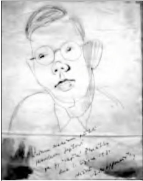
ADOLF HOFFMEISTER: JAROSLAV JEŽEK

Program, který jsme mohli vidět ve čtvrtek 10. prosince 2009 čili v den Lidských práv, měl kromě pěkné hudby i prvky, které se svým způsobem tohoto tématu týkaly. Mohli jsme slyšet Ježkovu hudbu, ale hlavně vidět výstavu o životě a díle Jaroslava Ježka. Talentovaný hudebník, který byl téměř slepý, se mohl projektovat a žít ve své vlasti až do začátku druhé světové války. Pak nastal exil, v kterém Ježek umírá.