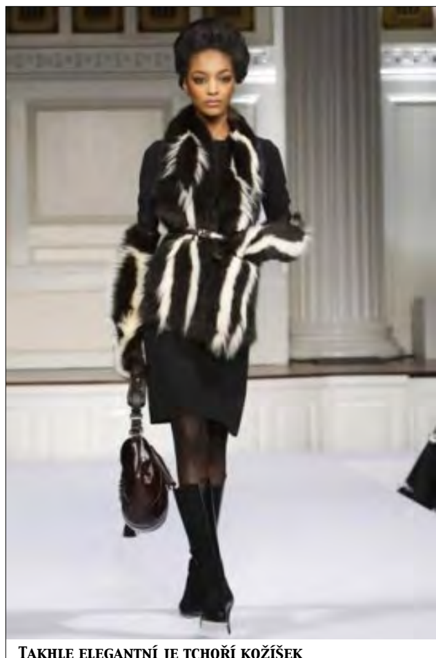
TAKHLE ELEGANTNÍ JE TCHOŘÍ KOŽIŠEK

„Skunkové žijí samotářsky, v únoru samci hledají samičky, taky se samci perou o příležitost k páření a v květnu samičky rodí 4-7 kotat, která jsou slepá, bezmocná a menší než dlaň, a trvá 6 týdnů kojení, než otevrou oči a začnou šmejdit s matkou. Samci se na výchově mladuch nepodílejí vůbec, žijí samotářsky až do příštího února, kdy hledají samice k plazení...“