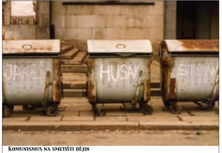
KOMUNISMUS NA SMETIŠTI DĚJIN