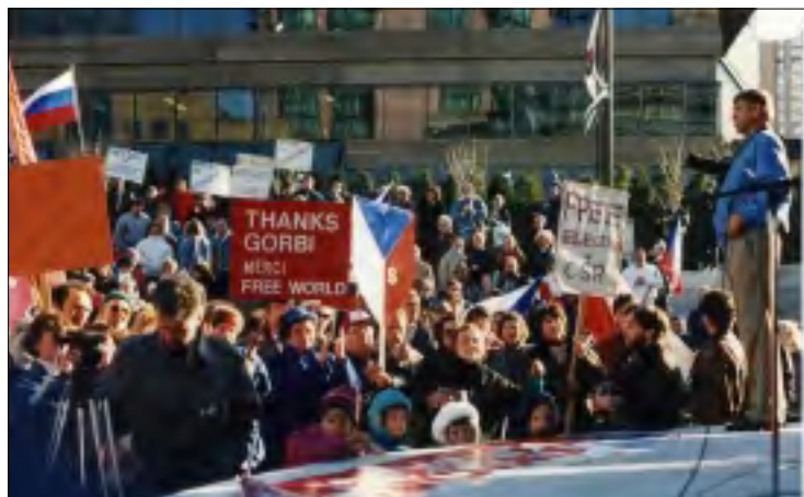
ČEŠI A SLOVÁCI SPATŘILI NADĚJI