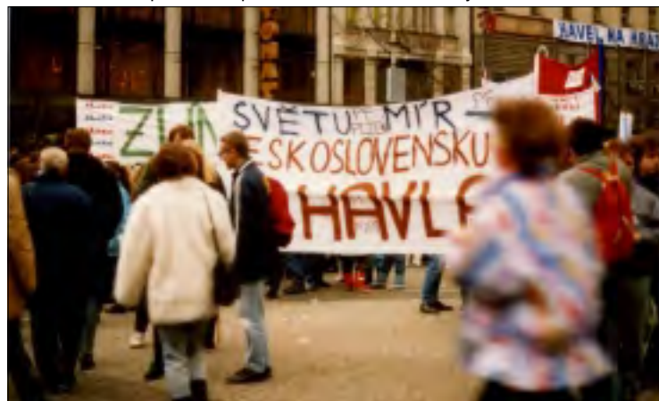
TOTO PŘÁNÍ SE TĚMĚŘ SPLNILO, ASPOŇ DRUHÁ POLOVINA

Mezitím se začalo budovat nezávislé kulturní středisko v Bolzanově ulici. Revoluce proběhla tak, že se místnosti nejprve vyklidily a vymalovaly. Trochu jsem se nad tímto revolučním počínáním podivil, ale dostalo se mi vysvětlení, že se nebude