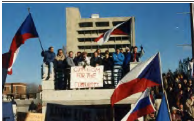
NÁMĚSTÍ V NORTH YORKU BYLO ZAPLNĚNÉ DO POSLEDNÍHO MÍSTEČKA

Jeho slova mohu potvrdit i z Toronto. Přestože jsem pravidelně přejímal zprávy ze Svobodné Evropy, v době kolem listopadu 1989 nebyla Svobodná Evropa zachytitelná. Když jsem jim volal, že nejsou slyšet, dostalo se mi logické odpovědi: