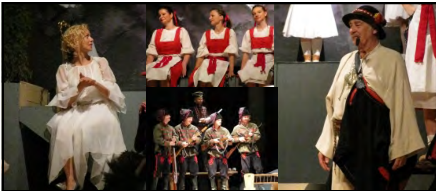
Z DIVADELNÍHO PŘEDSTAVENÍ: NA SKLE MALOVANÉ