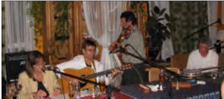
Z OSLAVY ŽIVOTA NA MASARYKTOWNU

Mnohé kultury jsou označovány podle toho, jak se loučí se svými zesnulými. Stačí se jen podívat na různé hřbitovy po Evropě. V Polsku těžko najdeme neozdobený hrob. Jiné jsou hřbitovy pravoslavné a naopak zcela odlišné jsou hřbitovy v severní Americe a zde v Kanadě. Podobně je tomu i s pohřbíváním. Dokud jsem žil v