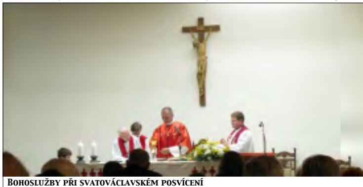
BOHOSLUŽBY PŘI SVATOVÁCLAVSKÉM POSVÍČENÍ

Letos byl tento den zvláštní právě tím, že se jednalo o kulaté výročí podle tradice byl svatý Václav zavražděn 28. září 929. Ovšem o tomto datu se vedou spekulace. Nikoliv o dnu, ale o roku. Někteří historici tvrdí, že to bylo již v roce 928, jiní se domnívají, že to bylo až v roce 935, jiní dokonce ještě o rok později. Při této příležitosti navštívil Českou republiku papež Benedikt XVI. Kromě Brna, kde sloužil mši pro 120 000 lidí, se zastavil v Praze na Malé Straně v původně v evangelickém kostele, kde je Pražské Jezulátko, setkal se s představiteli Ekumenické rady církví