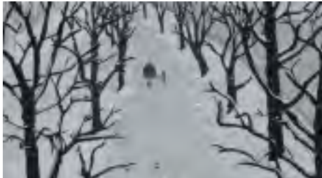
MŮJ PES TULPÁN