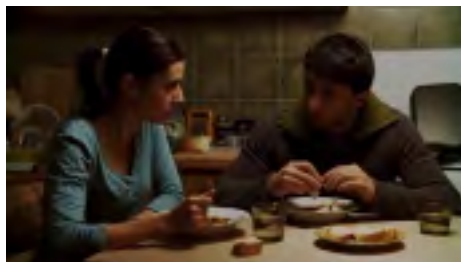
PRIDÁVNÉ JMÉNO: POLICEJNÍ

Moskvě kvartet Benny Goodmana a natočil zde legendární desku Benny Goodman in Moscow , takže něco se zde o Charlie Parkerovi vědět muselo. Jestli to bylo z pašovaných gramofonových desek nebo z cizího rozhlasu, je otázkou, ale pochybuji o tom, že by to bylo na lpěčkách, jak nám to chce namluvit film. Možná, kdyby byl posazen do zmíněného roku 1965 v době Chruščovovy perestrojky a odhalení kultu osobnosti, tak by to bylo věrohodnější. Film však v žádném případě věrohodný být nechce. Jedná se o muzikál a jako kdyby tato hudba z té doby chýběla a Todorovskij se snažil tuto mezeru po půl století vyplnit.