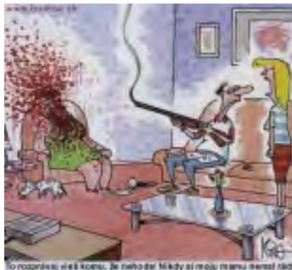
to rozpisuje, aťš k tomu, že nehodě nikdy si rogu mamu tenat řáti

Řekové jsou v podstatě takoví pohodáři, kteří rádi si posedí v hloučku svých přátel nebo rodiny na své verandě, nebo balkónu a přehnaný spěch je vzácnou výjimkou.