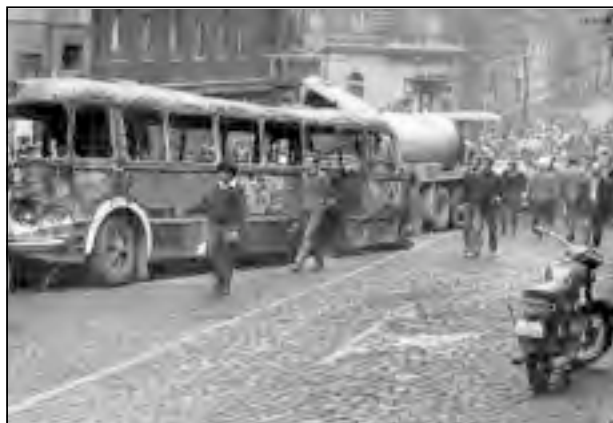
JEDNA Z TISÍCŮ FOTOGRAFIÍ ZE SRPNA 1968