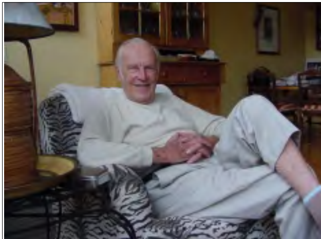
JAN RUBEŠ PŘI ROZHOVORU PRO SATELLITE V ROCE 2007

V úterý 30. června 2009 zemřel v Torontu Jan Rubeš, jeden z nejvýraznějších, nejmýznanějších a nejoblíbenějších představitelů československé kultury ve světě. Narodil se ve Volyni 6. června 1920, vystudoval gymnázium v Strakoncích (maturoval v roce Mnichova, 1938), zapsal se současně na lékařské fakultě Univerzity Karlovy a získal stipendium na Pražské hudební konzervatoři. Byl mužem s mnoha talenty. V mládí vynikal ve sportu (byl znamenitým tenistou a i v zralém věku vyhrál seniorské mistrovství Kanady a lyžařem), měl nádherný sametový bas-barytonový hlas, podmanivou osobnost a dobře vypadal.