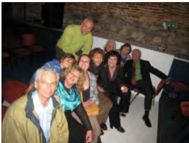
ZE ZÁJEZDU NA SLOVENSKO

Neobyčajne milo a profesionálne sa správal aj technický personál všetkých divadiel. Úplne chýbala tá povestná