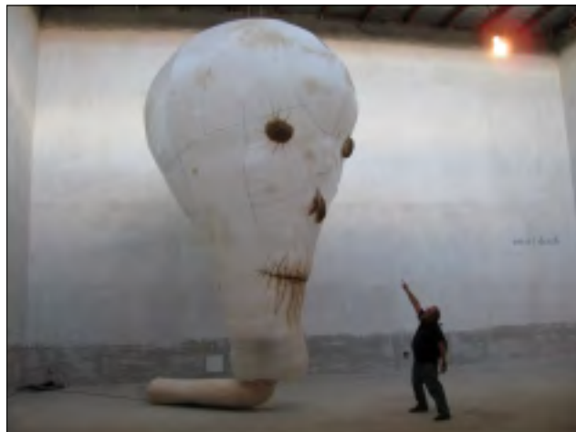
GALERIE DOX: KDYŽ VSTOUPÍTE DO MÍSTNOSTI, VYBAFNE NA VÁS SMRT

Veletržní palác má zase pro změnu výstavu českého moderního umění, kde