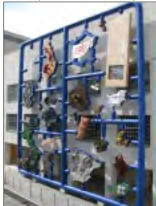
DAVID ČERNÝ - ENTROPA

fotografují. Mne více zajímalo dešifrovat jednotlivé země. Přiznám se, mnohdy se mi to nepodařilo. Není to však jediná