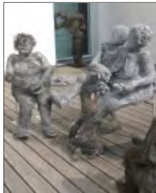
Z RESTAURACE GALERIE DOX