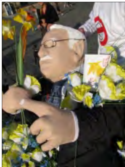
FIGURÍNA VÁCLAVA KLAUSE NA HRADĚ PŘI OSLAVÁCH JHO NAROZENÍ

Prezident Václav Klaus svými antikologickými aktivitami a zahleděním sám do své vlastní moudrosti se stal terčem, do kterého se strefuje svými šípy humor prostého lidu. Již v 15. století Jeroným Pražský pořádal happeningy, při kterých si dělal legraci z mocných, včetně Václava IV. Ani jeho jmenovec Václav Klaus