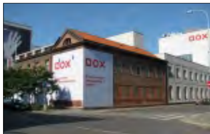
NOVÉ CENTRUM SOUČASNÉHO UMĚNÍ DOX V PRAZE