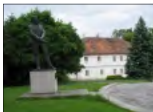
SOCHA ANTONÍNA DVOŘÁKA A JEHO RODNÝ DŮM V NELAHOZEVSI

Jestliže zámek Hluboká je památkou na dobu Schwarzenbergů, pak další zámek poblíž Prahy v Nelahozevsi je náhledem do šlechtického interiéru rodiny Lobkoviců. Navíc je toto místo rodištěm nejslavnějšího českého hudebního skladatele Antonína Dvořáka.