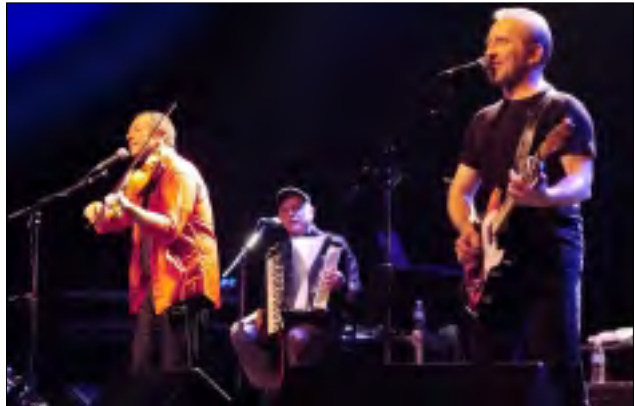
ČECHOMOR V TORONTU