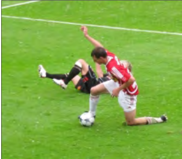
SNÍMEK DOKLÁDÁ, ŽE NA ŽIŽKOVĚ SE BOJOVALO TVRDĚ, ALE ČISTĚ.