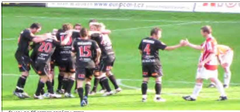
SLAVIA PO 66 LETECH OBHÁJILA TITUL