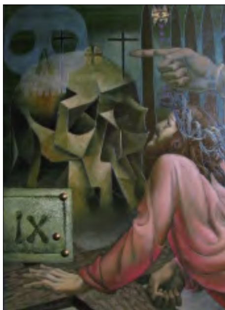
V. RADA: KŘÍŽOVÁ CESTA - IX. ZASTAVENÍ

Nejsem rád, když se politika míchá s náboženstvím. A chápu ten americký důraz na oddělení těchto dvou sfér. Největšími zéloty jsou pak lidé, kteří o víře prakticky nic nevědí. Proto jsem také hleděl s určitými otázkami k setkání zástupců tří církví s presidentským kandidátem Janem Švejnar, které se konalo minulý úterý v kostele Československé církve husitské v Praze na Vinohradech. V průběhu setkání (trvalo osmdesát sedm minut podle stopáže na magnetofonu a je dostupné na našich webových stránkách www.zpravy.ca) profesor Švejnar vysvětlil velice podrobně vznik ekonomické krize i způsob, jakým mají postupovat vládní intervence, aby se důvěra v trh