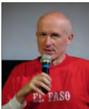
REŽISÉR ZDENĚK TYČ

kteřá má nikoliv sedm, ale dokonce devět dětí a že jí hrozí jejich odebrání a ona se nechce těch dětí vzdát. Tak jsem se začal zajímat o to, jestli ji už někdo zastupuje. Dověděl jsem se, že je již právníčka, která ji zdarma hájí. Na tu jsem získal po čase kontakt a požádal jsem ji o spojení s touto ženou, která bydlí v Českých Budějovicích a která už byla vystěhovávána na ubytovnu. Začátek byl poněkud rozpačitý, protože ona už měla špatné zkušenosti s lidmi kolem, a byla k nim trochu ostřejší. I k lidem, kteří měli zájem o tento případ. Když mi otevřela dveře, tak jsem se představil a řekl jsem jí, že znám její případ, jestli by dokázala něco o sobě říci, protože by z toho mohl být film. Ona chvíli zvažovala, jestli se se mnou bude bavit nebo ne. Pak jsem tam jezdil stále častěji a líbil se mi její postoj. Zajímavá byla změna, že se musela zabývat novou skutečností,