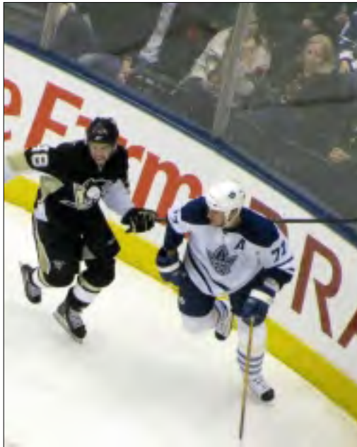
PAVEL KUBINA (77) V SOBOJI S KENNEDYEM

PK: Po druhém gólu se nám podařilo dát kontaktní gól na 1:2, mužstvo se zvedlo a připravilo si řadu šancí. Navíc nám zachytil výborně Toskala.