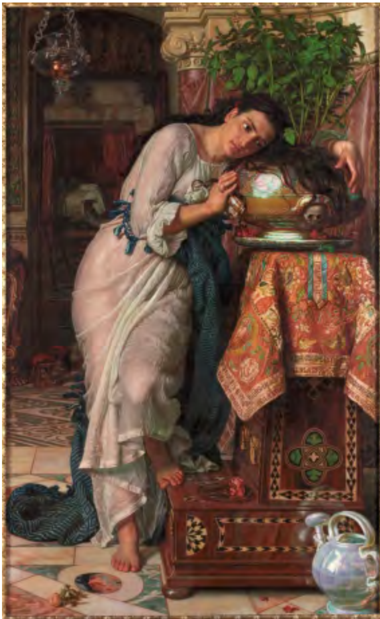
William Holman Hunt (1827-1910), Isabella and the Pot of Basil , 1866-8, retouched 1886, oil on canvas, 187 x 116.5 cm. Laing Art Gallery, Tyne and Wear Museums

Od 14. února do 10. května 2009 je v nově otevřené Art Gallery of Ontario výstava anglického malíře Williama Holmana Hunta a několika jeho současníků, kteří se vrátili v polovině 19. století do předrafaelitského období. Kromě figurální a religiozní tvorby můžeme vidět i krajiny z oblasti Palestiny, kde Hunt delší dobu pobýval. Podle jeho obrazu Krista je například i vitráž v Unitařském kostele na St. Clair, kde jsou pořádány koncerty Mozartovy společnosti. Hunt se narodil v roce 1827 v Londýně, byl dvakrát ženat. Od roku 1844 navštěvoval královskou akademii, kde potkal Johna Everetta Millaise a Dante Gabriela Rossetiho. V roce 1853 prošel náboženskou zkušeností, která poznamenala jeho tvorbu na celý život. Na výstavě je přes šedesát obrazů, můžeme zde vidět i jeho biblické ilustrace. Výstava je organizována ve spolupráci s Manchester Art Gallery, svá díla zapůjčily i Tate Britain, the Birmingham Museums and Art Gallery, National Gallery of Canada, the Cleveland Museum of Art a the Minneapolis Institute of Art.