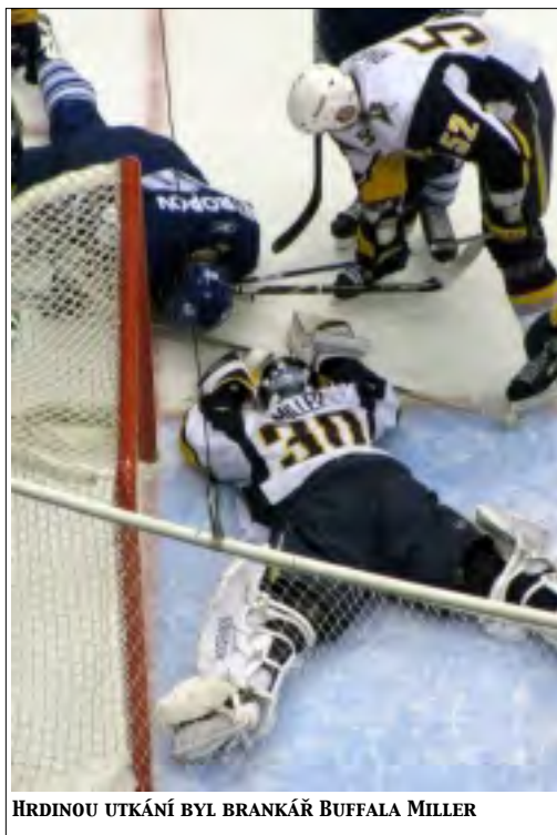
HRDINOU UTKÁNÍ BYL BRANKÁŘ BUFFALA MILLER

ABE: Odešel jste jako mladý hráč ze Slovenska. Nyní mají mladí hokejisté svůj tým, který působí v extralize. Co soudíte o tomto experimentu?