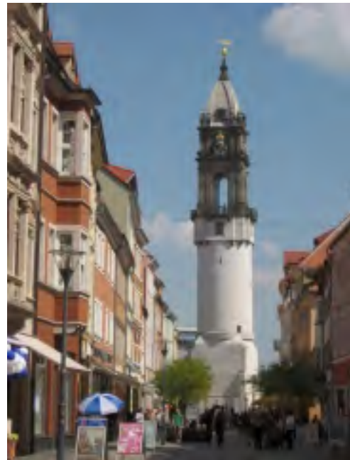
Budyšín, Bohatá weža, stavba z r. 1490, nejmějsí hned po věži v Pise

- dostalo přijetí téměř královského. Zastavili jsme se na chvíli v předsíni, a najednou se otevrou dveře a milá žena v kroji nás vřele vítá, jako by čekala jen a jen na