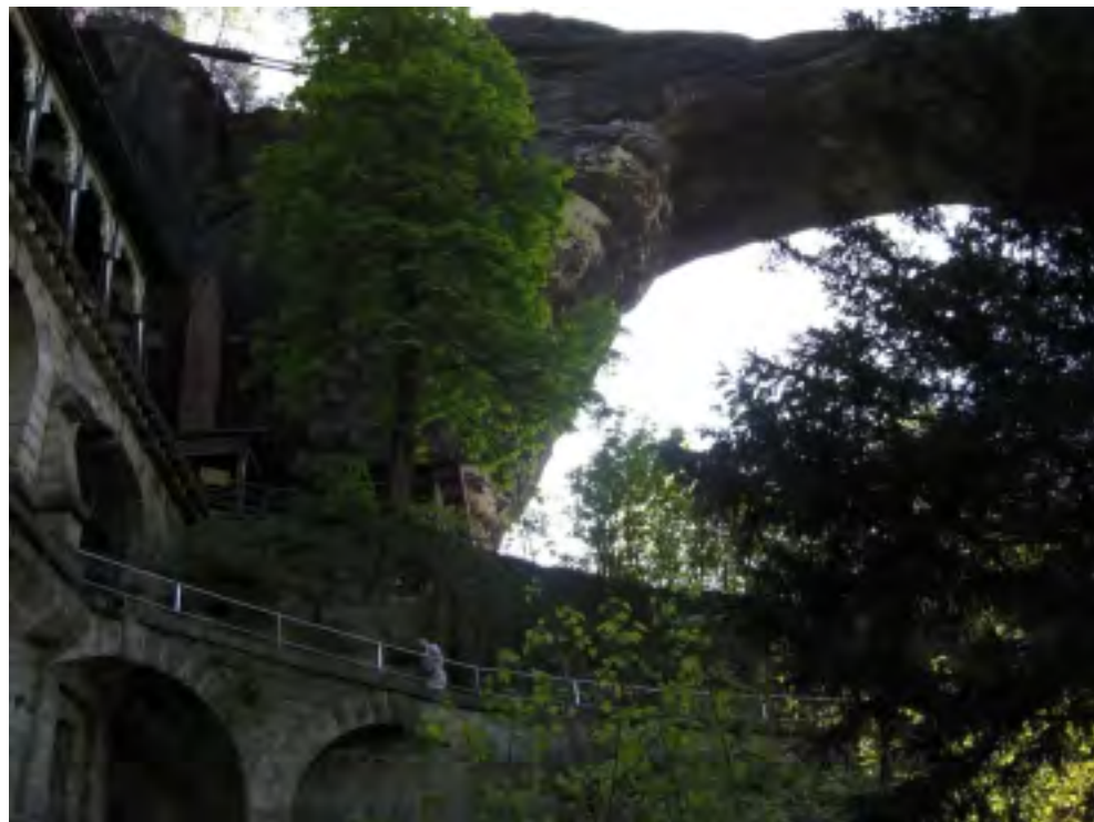
Pravčická brána - Oblouk 25 m dlouhý a 21 m široký

nás. A jaká je místní kuchyně? Je podobná české a německé. Například hovězí s křenovou omáčkou je jako od maminky. O tom, že pohostinství zde drží krok s módou, svědčí přidání orestované zeleniny. To by si měly osvojit mnohé české restaurace. Poněkud nezvyklý pokrm je však salát s uzeným kaprem. Ten má podobu úzkých proužků, které vypadají jako šunka. Vánočního kapříka pokrm nijak nepřipomíná.