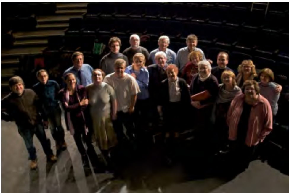
AKTÉRI HRY HORÚCE LÉTO 68