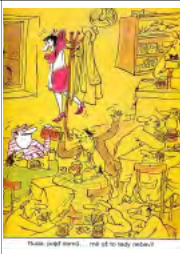
Hlas, jaký mám... mě už to tady nebaví!