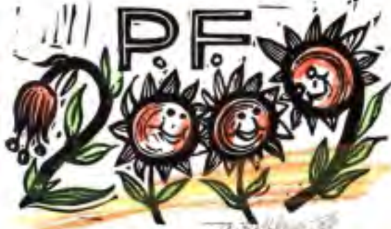
OD JANA ROTBAUERA - AUTOREM AKADEMICKÝ MALÍŘ JAROSLAV ROTBAUER