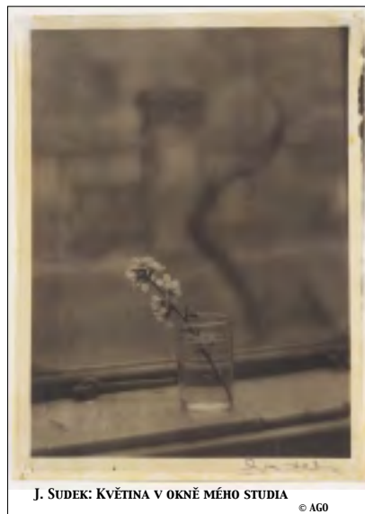
J. SUDEK: KVĚTINA V OKNĚ MÉHO STUDIA