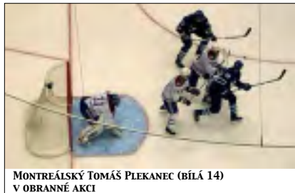
MONTREÁLSKÝ TOMÁŠ PLEKANEC (BÍLÁ 14) V OBRANNÉ AKCI