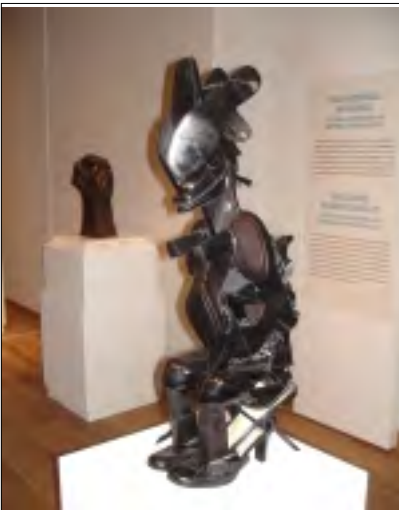
W. COLE: MATKA A DÍTĚ SOCHA Z DÁMSKÉ OBUVI

jindy nespátli. To se během let nějak vytratilo. Stadión zpustnul. Hrál se na Strahově. Zdálo se, že je ta slavnostní atmosféra nenávratně pryč.