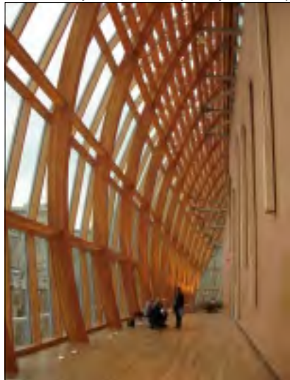
SEVERNÍ STĚNA AGO - ZE VNITŘÍ

Půl hodiny před koncem zápasu se objevil první nespokojenec, pesimista, či nepřítel, který opouštěl stadion a mířil na tramvaj. Když byl stav nepřiznivý, dav opouštěl stadion i pět minut před koncem, pak visely na tramvajových tyčích a ve Vršovicích se objevovala čísla tramvají, která jsme tam nikdy