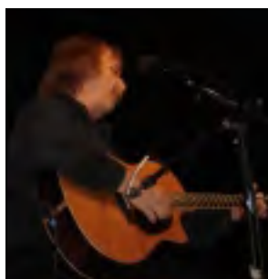
J. NOHAVICA V TORONTU

Jarek Nohavica je pokračovatelem slezské poezie. Zpívá jak v slezském nářečí, tak v polštině, češtině i slovenštině. Je svůj. Co se mně na něm nelíbilo, když se stavěl do pozice bojovníka za svobodu. Jeho politická prohlášení mně někdy připadala laciná a neměl to zapotřebí. To tentokrát