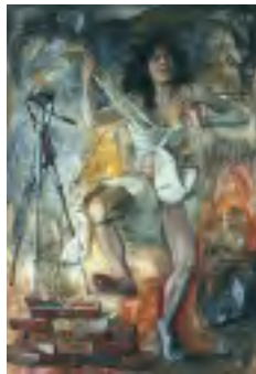
The Joker's New Clothes