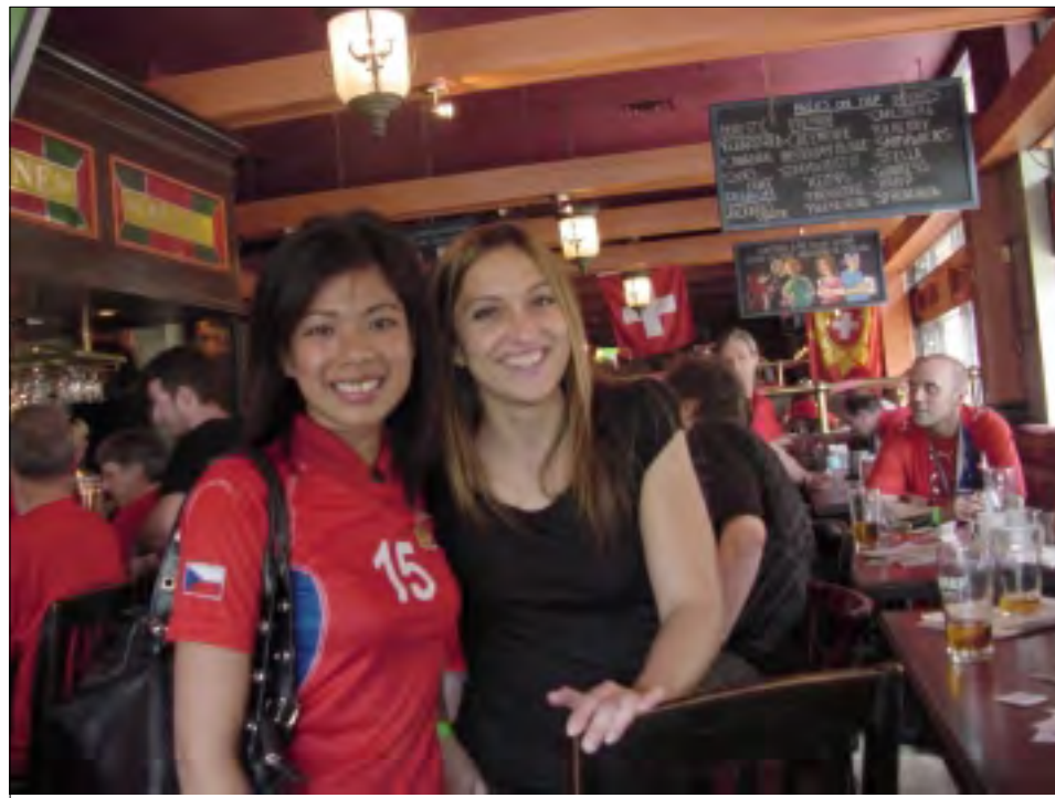
NEJEN ČESKÉ FANYNKY PŘIŠLY FANDIT ČESKÉMU TÝMU DO FOXES DEN