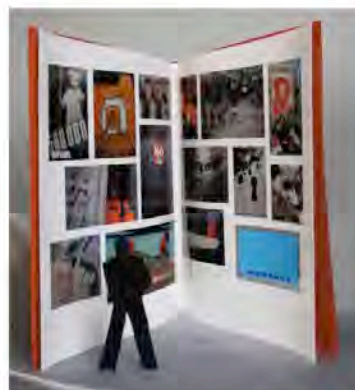
Model navrženého památníku zevnitř