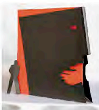
Model navrženého památníku zvenku

Zveme všechny čelné organizace VŠECH komunit v Kanadě poznamenaných komunizmem, aby tento projekt podpořily a napsaly v knize svoji vlastní "kapitolu".