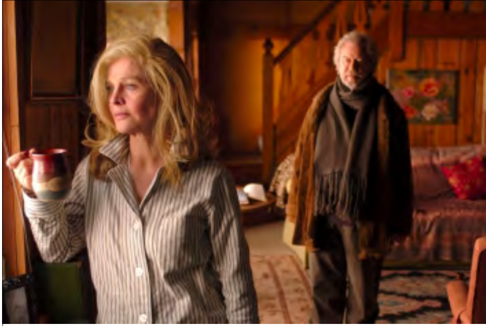
Z KANADSKÉHO FILMU DALEKO OD NÍ

Hlasitě propagovaný český film zůstává ale v porovnání s tím, co se točí v Rumunsku, v Rusku, Maďarsku a v Polsku drzým, tak trochu opožděným spolužákem. A to i kritikou ceněný snímek Pravidla lázi Roberta Sedláčka v tématice karlovarské soutěži Na východ od západu zcela zapadl. Vedle velkých témat filmů