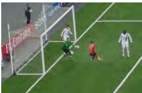
PŘED AMERICKOU BRANKOU. Z UTKÁNÍ RAKOUSKO-USA 2:1.