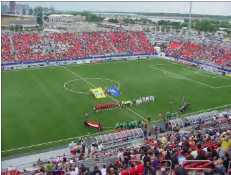
NEJVĚTŠÍ FOTBALOVÁ UDÁLOST V KANADSKÉ HISTORIÍ. MS DO 20 LET VYVRCHOLÍ TUTO NEDĚLI V TORONTU. BUDOU ČEŠI VE FINÁLE NEBO BUDOU HRÁT O TŘETÍ MÍSTO?