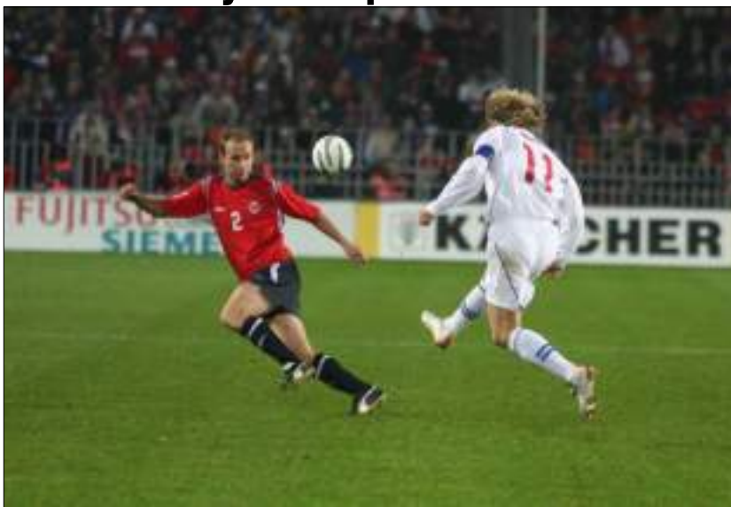
PAVEL NEDVĚD PŘIŠEL V PRAVÝ OKAMŽÍK!