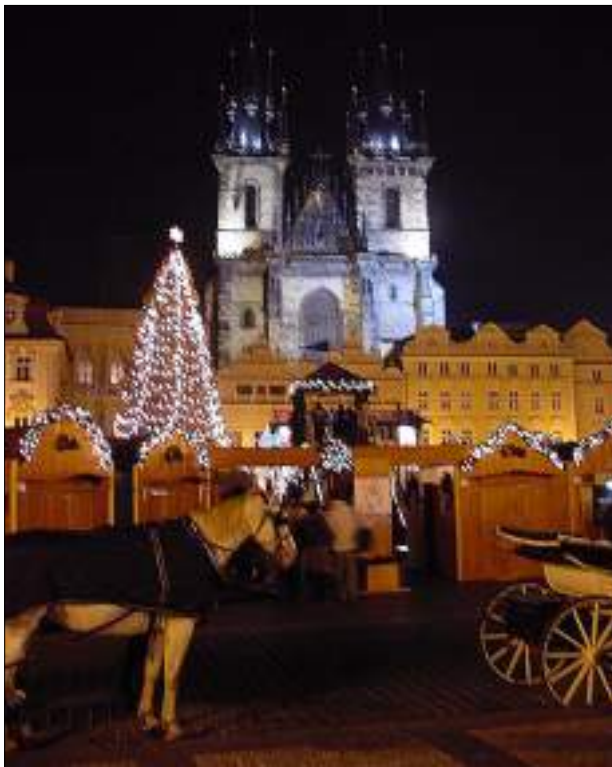
ADVENT PŘÍŠEL I NA STAROMĚSTSKÉ NÁMĚSTÍ