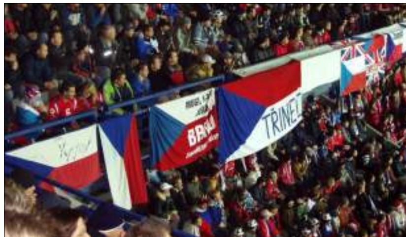
FANOUŠCI Z TRINEZU MAJÍ SICE VLAJKU OPAČNĚ, ALE SRDCE MAJÍ NA SPRÁVNÉM MÍSTĚ.

Byla přede mnou dlouhá neděle. Za jeden den jsem