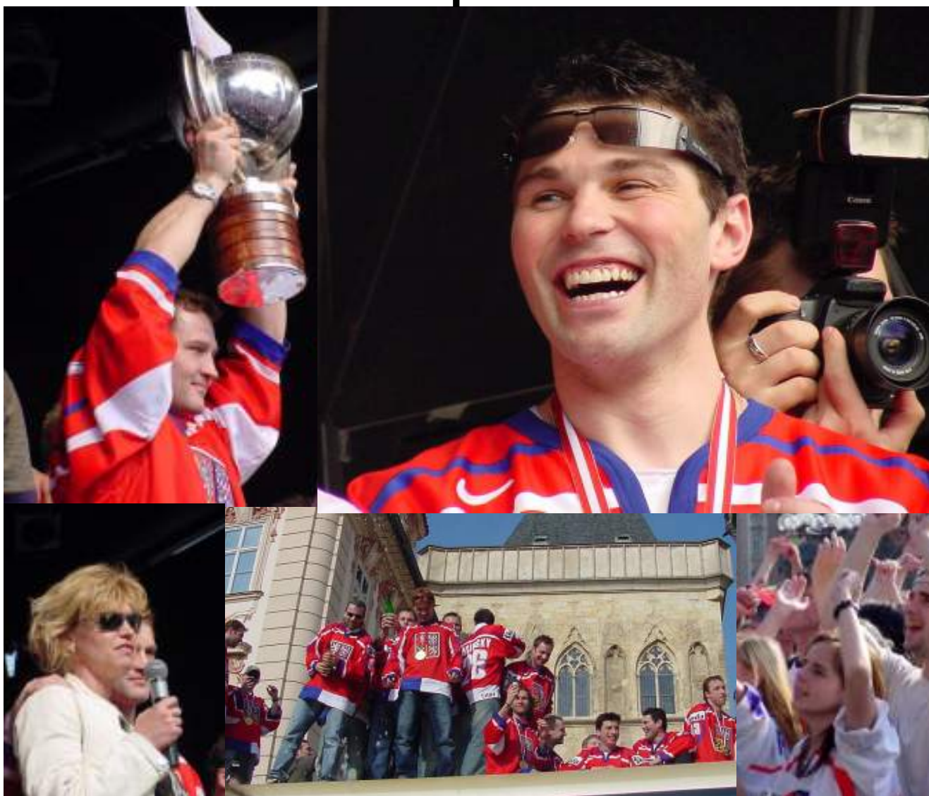
Vpravo nahoře Jiří Šlégr svírá pohár, vlevo Jaromír Jágr. Dole je vdova po Ivanu Hlinkovi, uprostřed autobus s mistry světa na střeše, vpravo příznivci na Staroměstském náměstí.