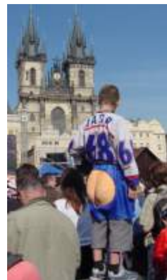
To si přeje Jaromír Jágr nezastuhuje...

Mail zdůrazňuje, že pro Kanadany bylo důležité pouze vítězství a toho nedosáhli. List dále cituje Jaromíra Jágra, že pro Kanadany bylo těžké hrát takový turnaj, když se v Kanadě hokej letos nehrál. Okamžitě po skončení utkání propukly nejen ve Vídně, ale i ve všech českých hospůdkách a krčmách náležitě oslavy. Lid se radoval do časných ranních hodin. Nejen prostý lid, ale i prezident Václav