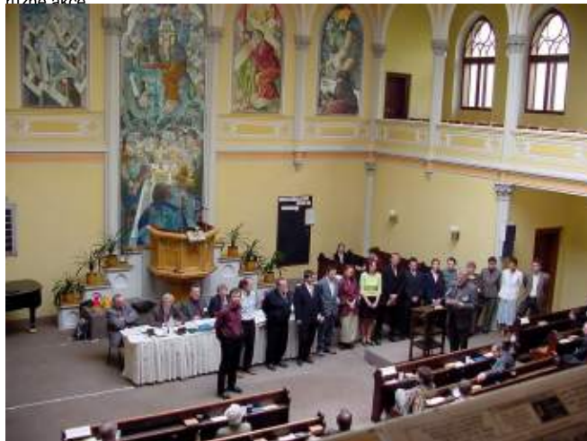
Představení nových duchovních na Synodu CCE.

MŠ: Byla jsem v kontaktu s církví již v Čechách, protože jsem z věřící evangelické rodiny. V Kanadě jsem chodila s rodinou, kde jsem žila do United Church, což bylo velice příjemné společenství. Měla jsem pocit, že to byl živý sbor. Společně dělali různé akce