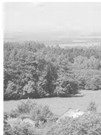
Okolí Prosečí z rozhledny Tereza