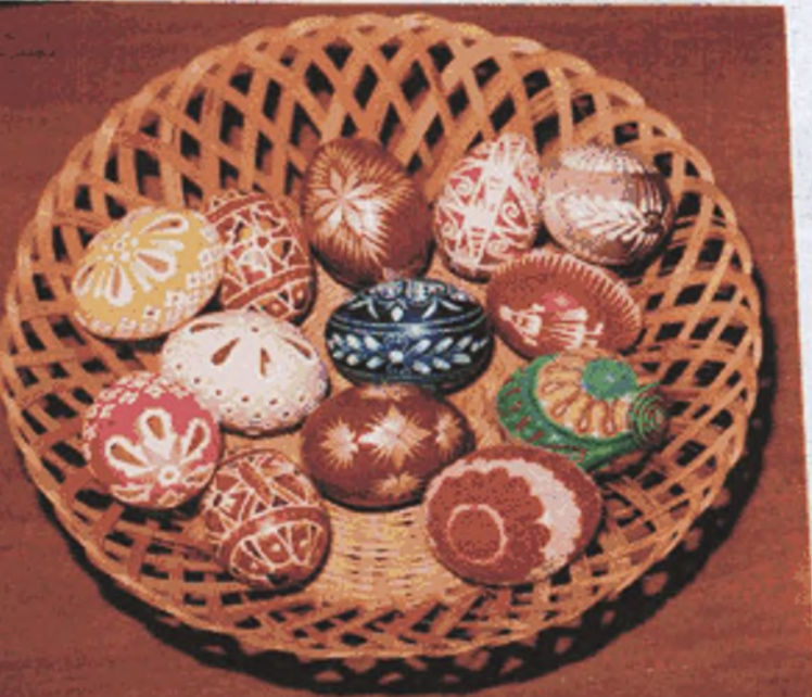
on left 5 Easter eggs from Bohemia (3 'carved') in centre 3 from Moravia (2 decorated with straw) on right 5 from Slovakia (2 decorated with wool)