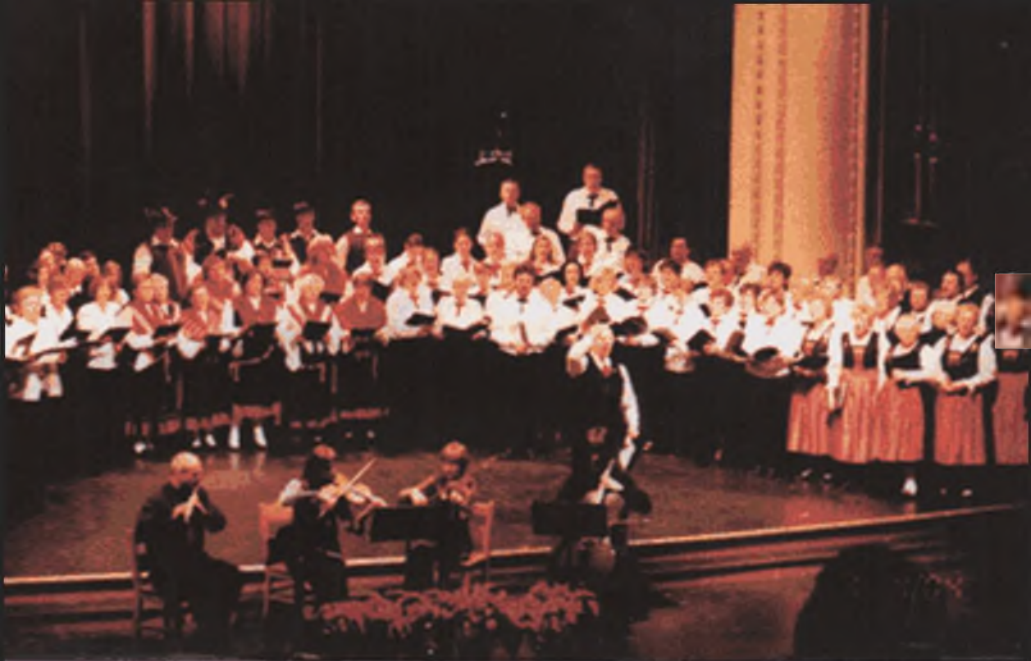
Slovak and Czech Folksingers of Edmonton - January 4, 2004