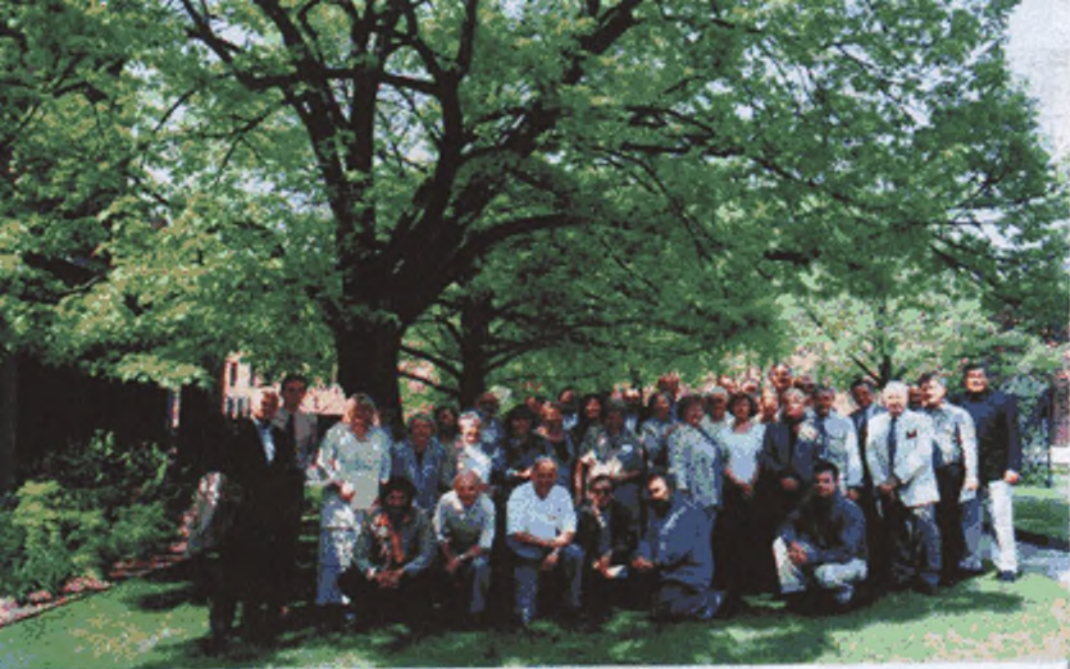
Delegates 55 th Congress Czech and Slovak Assoc. Toronto, May 25, 2003