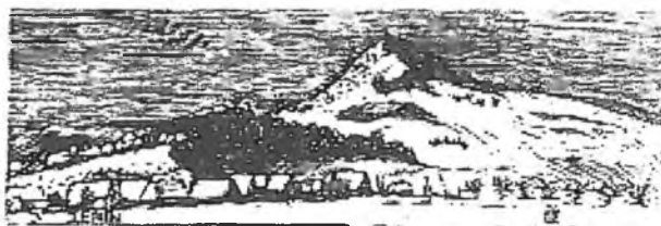
Česká krajina a barsko Petr Hlaváček