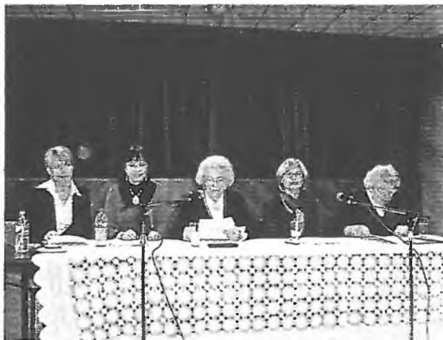
Učinkující na přednášce o Dvořákovi