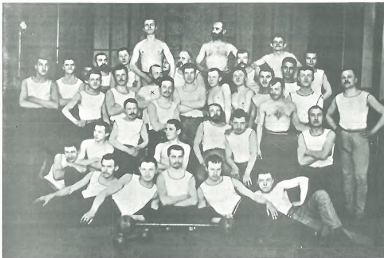
Cvičící členstvo Sokola Menšího města Pražského z r. 1892, mezi nimiž jest prof. T. G. Masaryk x.

PŘÍJĎTE NA XI. SOKOLSKÉ ŠIBŘINKY Ráz: AŤ ŽIJE MÓDA Macabean Hall Darlinghurst, Road Darlinghurst SOBOTA 30. ZÁŘÍ 67. 8H. VEČ. ZÁBAVA-Půlnoční Scena-Tanec-ZPĚV