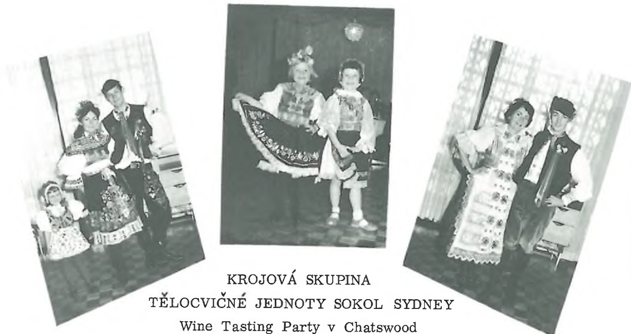
KROJOVÁ SKUPINA TĚLOCVIČNÉ JEDNOTY SOKOL SYDNEY Wine Tasting Party v Chatswood