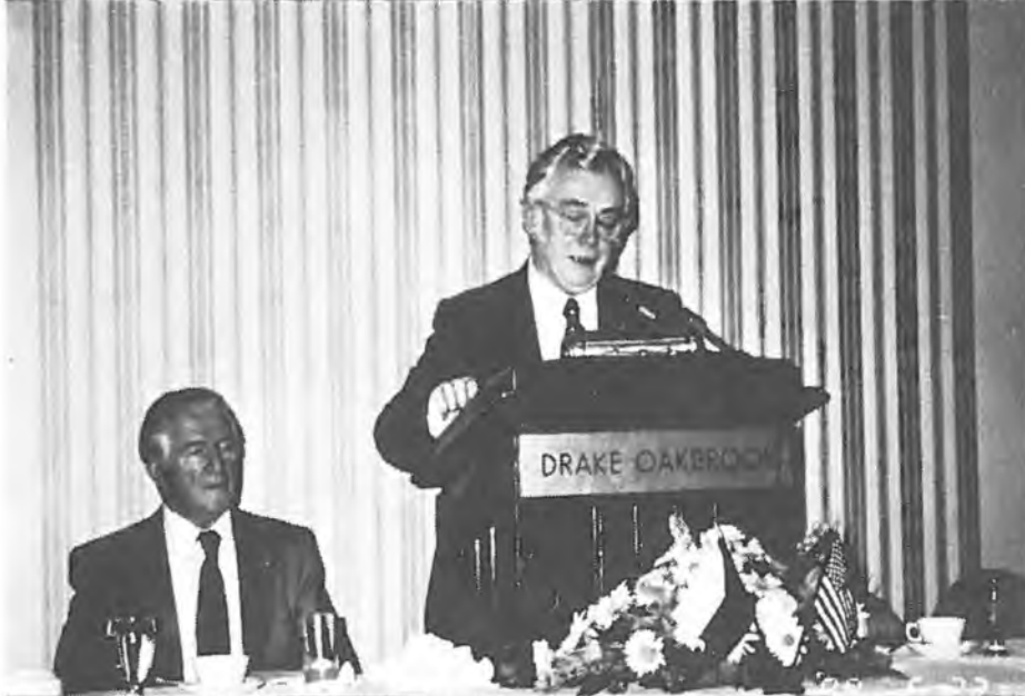
Prof. J. Škvorecký referuje o literatuře vytvořené československými spisovateli v zahraničí.