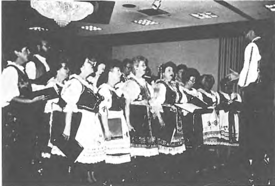
Pěvecké sdružení ZORA.