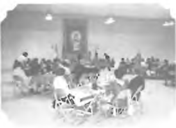
ÚČASTNÍCI BANKETU V LOYOLA HIGH SCHOOL