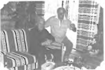
NA VEČEŘI U KORBÁŘŮ