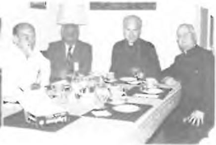
OBČERSTVENÍ V CONNOLLY H.