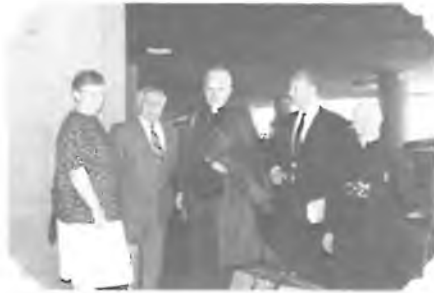
PŘIVÍTÁNÍ NA LETIŠTI