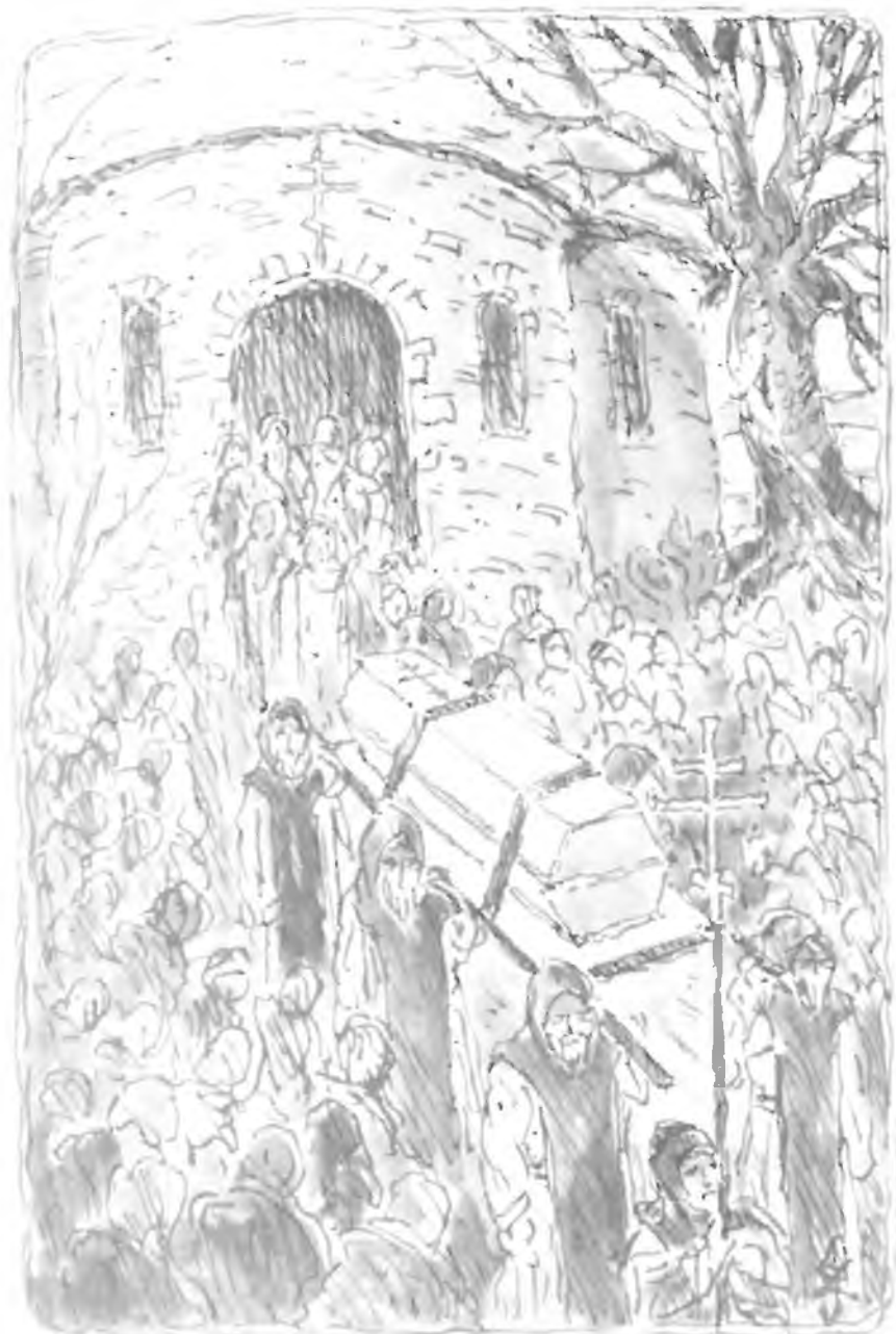
POHŘEB SV. METODĚJE R. 885 NA VELEHRADĚ

Poslední obrázek ze seriálu mistra JIŘÍHO ZAVŘELA, který nakreslil u příležitosti jubilejního roku sv. Metoděje - k 1100 výročí jeho smrti na Velehradě.