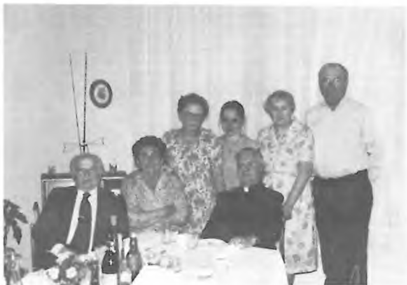
Krajané ze San Franciska na večeři u Dvořáků

Hořejší obrázek představuje mladé muže, kteří se rozhodli následovat hlas Kristův pracovat na jeho vinici, která je v přítomné době v moci atheistických uchvatitelů, ale jako církev vítězně přežila Nerona a Diokleciána, tak vítězně přežije i dnešní pronásledovatele Církve.